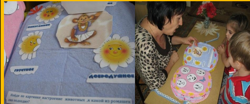
Дети сопоставляют настроение животных и ромашек