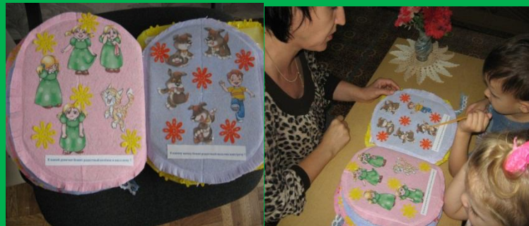
Подбор по эмоциям щенка и хозяина.