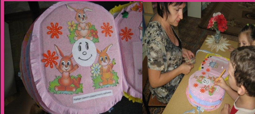
Игра «Найди радостного зайца»