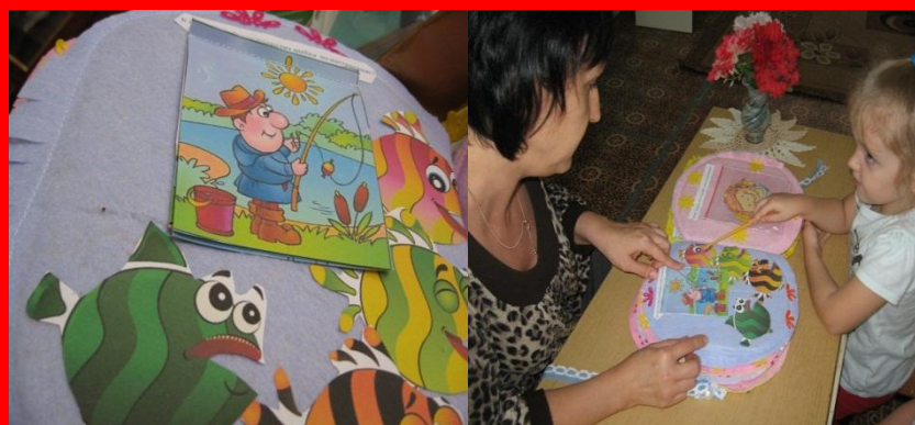
Сравниваем настроение рыбок и рыбаков