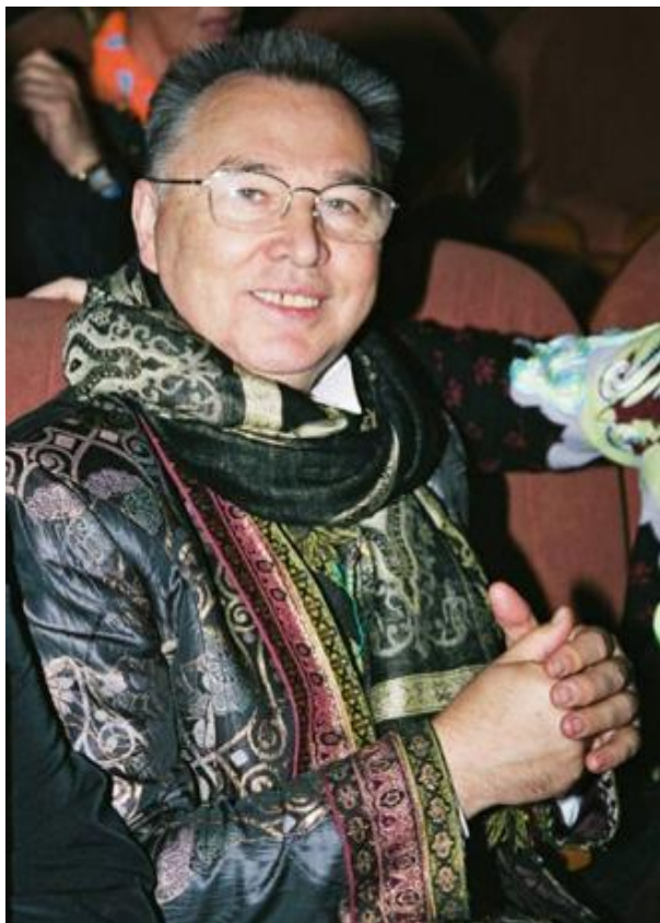
Вячеслав Михайлович Зайцев