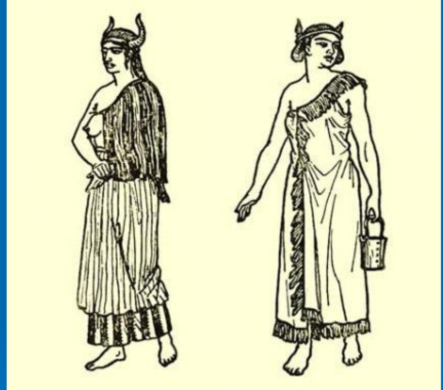
Жрицы богини Астарта.

Финикийцы поклонялись богу Ваалу. Его имя означает "хозяин, владыка". Он считался богом грома и молний, бури, войны, но также и покровителем государства. Своим богам финикийцы приносили человеческие жертвы: в раскрытую пасть огромного идола, в которой пылал огонь, бросали младенцев.