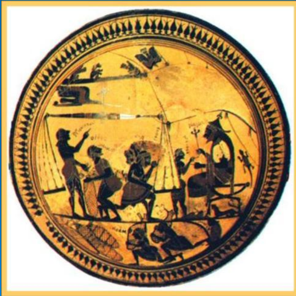
Разгрузка финикийского корабля