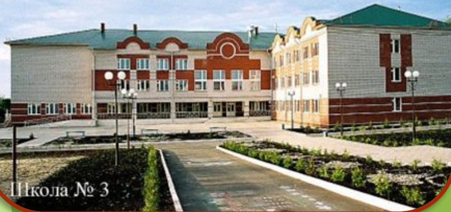
Школа № 3

Привыкли рядом мы идти Уж много лет подряд! Несёт наш школьный коллектив Всем бодрости заряд!