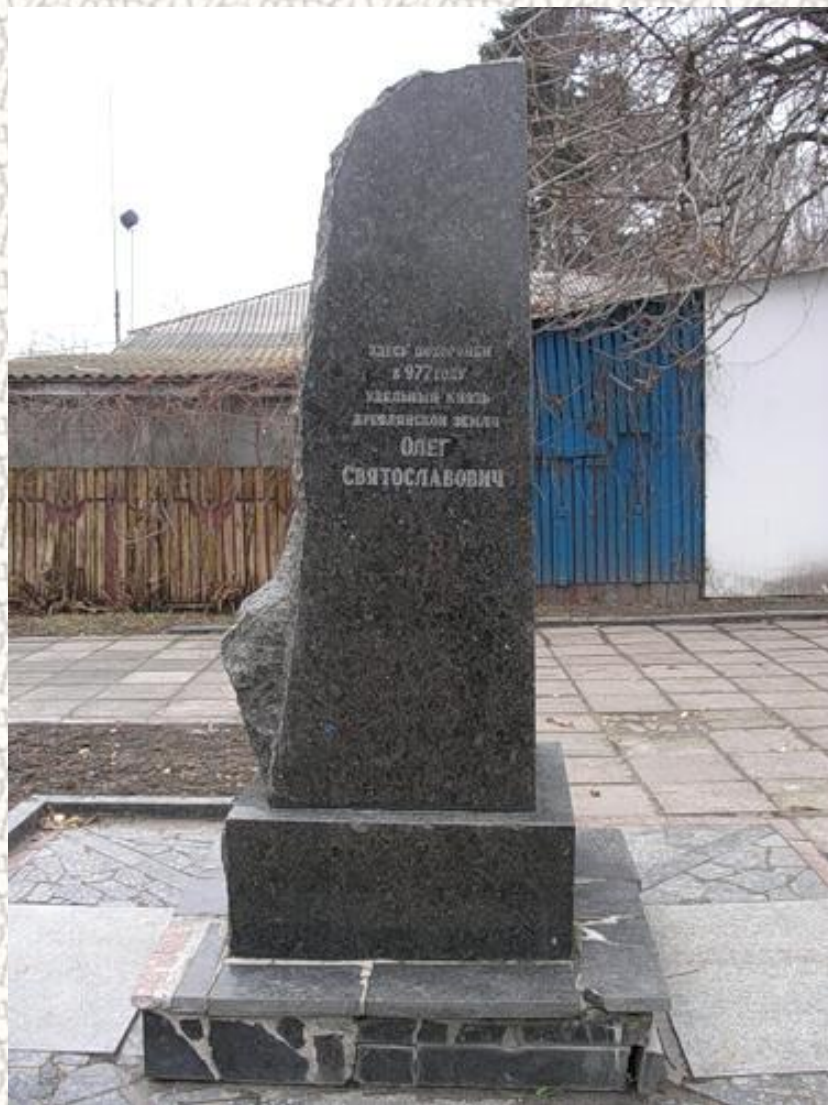
Г. Овруч, Украина. Здесь похоронен в 977 году удельный Князь древлянской земли Олег Святославович

Из-за малолетства князей управлять княжеством помогали бояре. Не без помощи воевод и бояр между сыновьями Святослава возникла усобица. Ярополк пошел против Олега. При бегстве со своей дружиной Олег упал с моста и погиб, задавленный падавшими на него пешими и конными воинами. Огорчился Ярополк, но ничего уже поделать не мог.