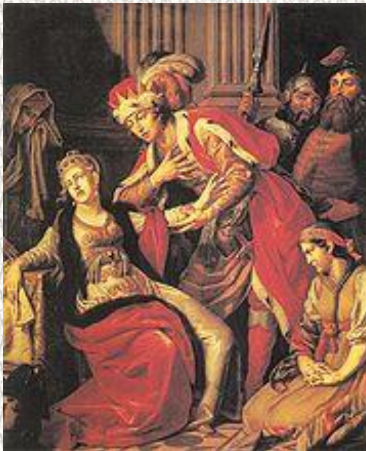
А. П. Лосенко. Владимир и Рогнеда, 1770

Рогнеда же объявила, что хочет быть женою князя Ярополка, а не Владимира, рожденного от Святослава Малушей — служанкой Ольги.