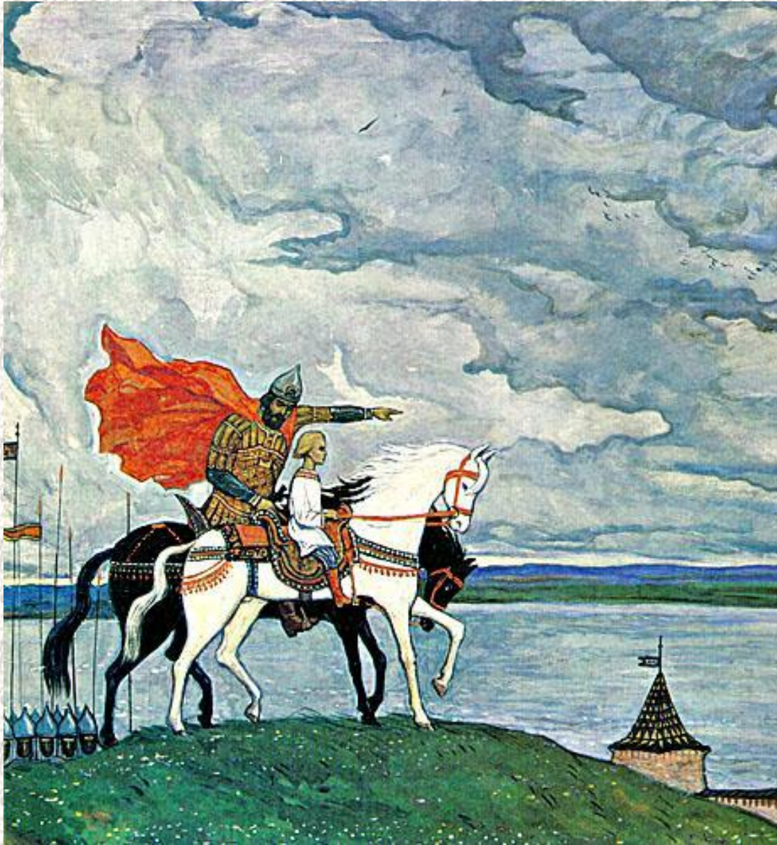
И. Глазунов. Два князя

Лет в пятнадцать или даже раньше сын князя мог уже оказаться самовластным князем, поэтому княжеского сына садили на коня с младенческих лет. Отрок-князь в девять- десять лет уже мог участвовать в военных походах