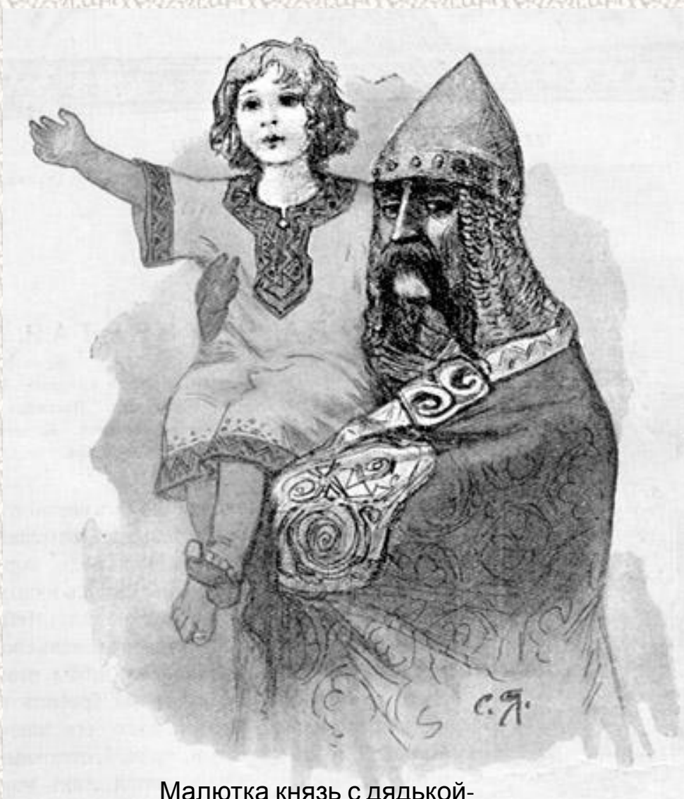
Малютка князь с дядькой- кормильцем

В Древней Руси княжеские заботы на наследников великих князей ложились из-за безвременной кончины отцов очень и очень рано.