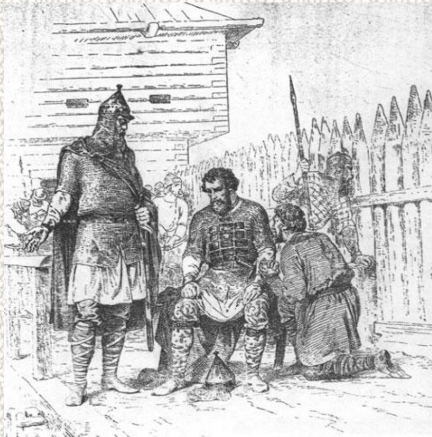
Верещагин В. Великий князь Ярополк Святославович

Узнав о смерти Олега, Владимир решил отомстить Ярополку и отправился за помощью к варягам. «Не я зло начал, мне должно за кровь невинную мстить и себе снискать безопасность», — так оправдывал себя Владимир-язычник, готовясь выступить против Ярополка.