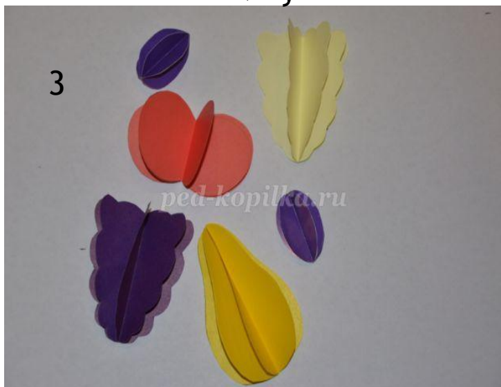
3 Склеиваем заготовки по линии сгиба