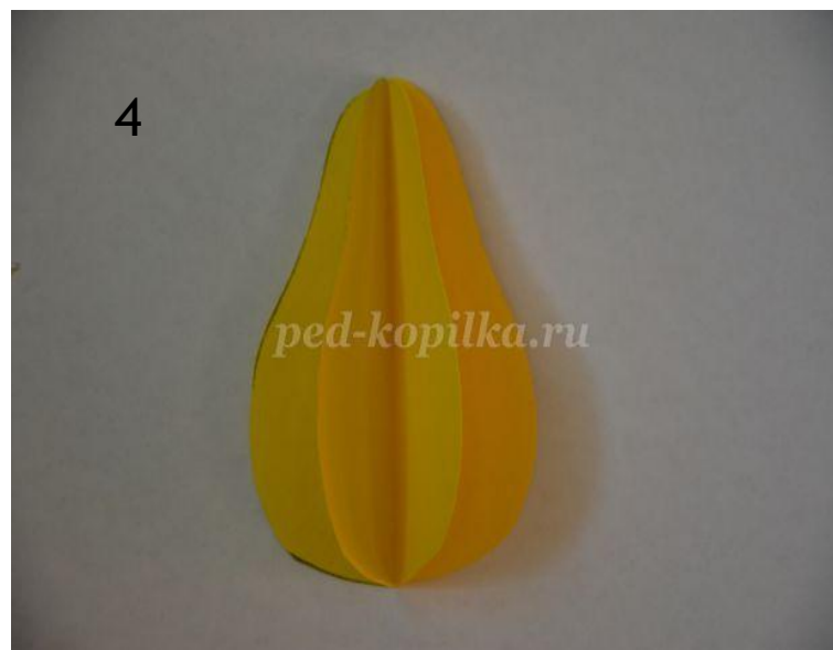
Склеиваем заготовки по линиям сгиба