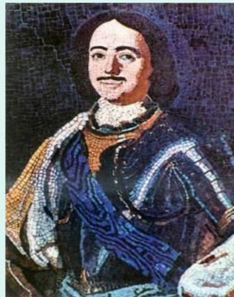
Мозаика «Пётр 1»