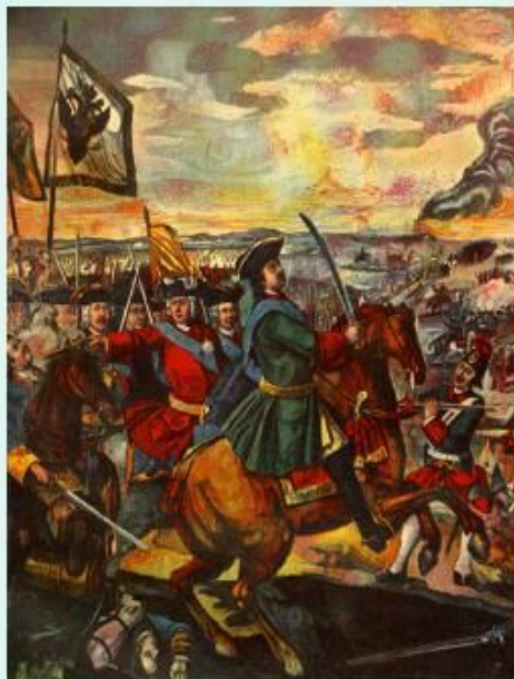
Мозаика «Полтавская битва»

Ломоносов открывает мастерскую для изготовления картин из мозаики и сам становится первым в России человеком, который начал на собственном опыте и своими руками осваивать технику МОЗАИКИ .