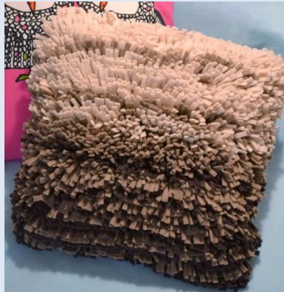
Идея 3. Подушка пушистая