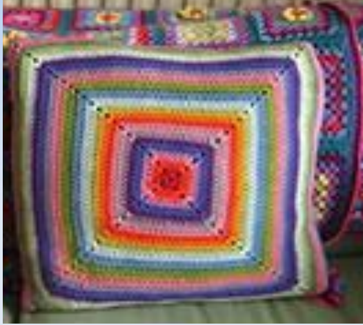
Идея 1. Вязаная подушка