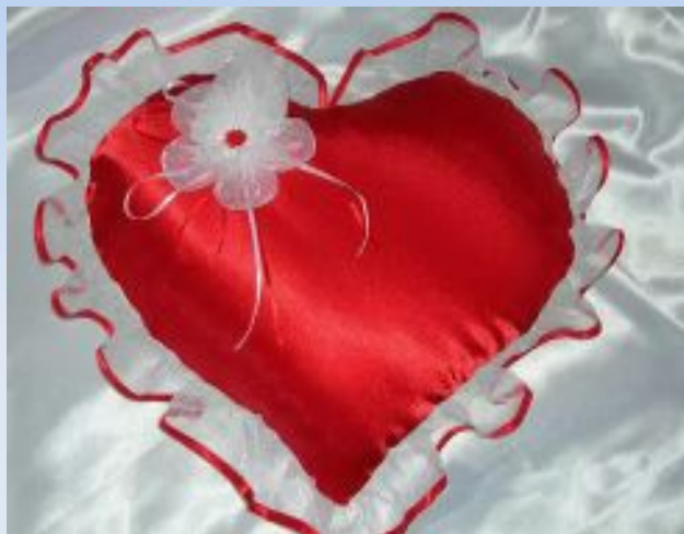
Идея 1. Подушка в форме сердца