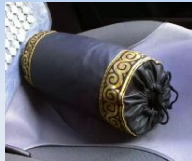
Идея 2. Подушка валик