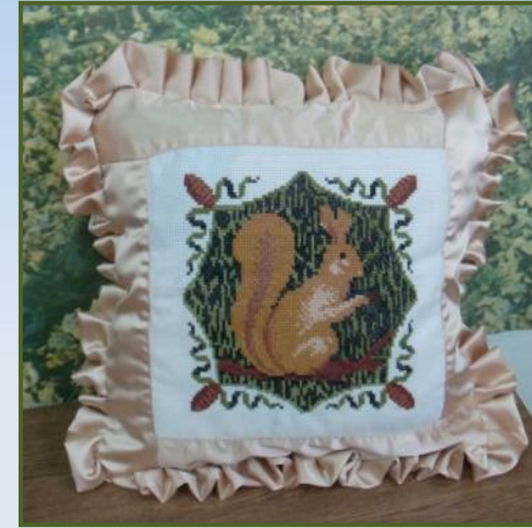
Идея 2. Подушка с вышивкой