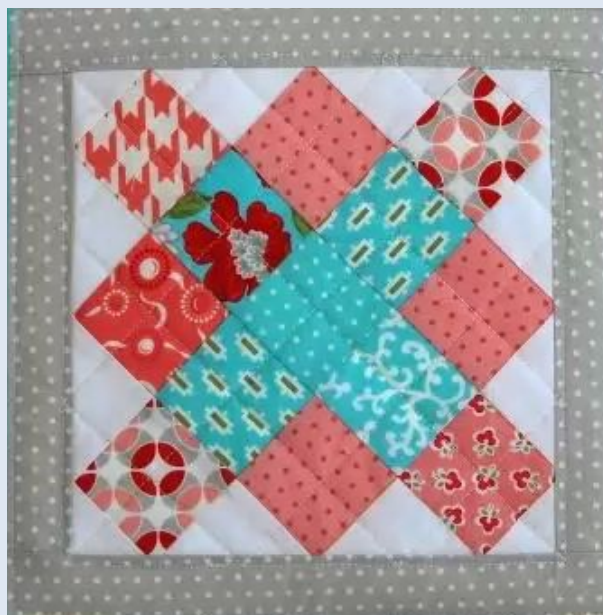
Идея 3. Подушка квадратная