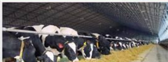
ФОТО ДЛЯ СМИ

ПРОВОД-СЛУЖБА ГУБЕРНАТОРА И ПРАВИТЕЛЬСТВА