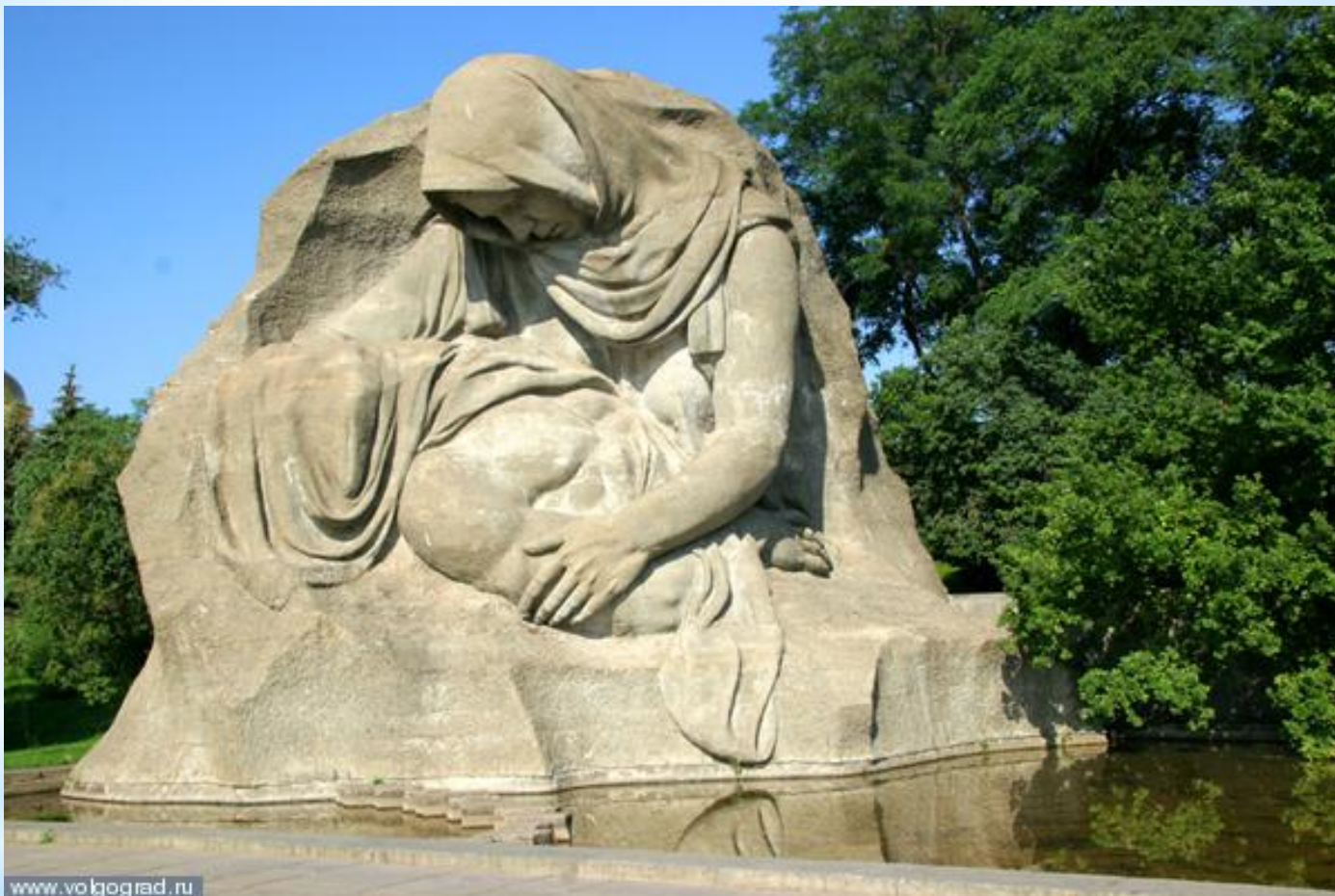
* Скорбящая мать