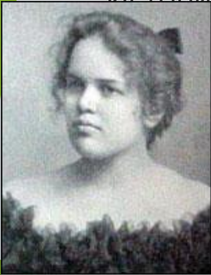
Adelaide Crapsey, creator of the American cinquain.