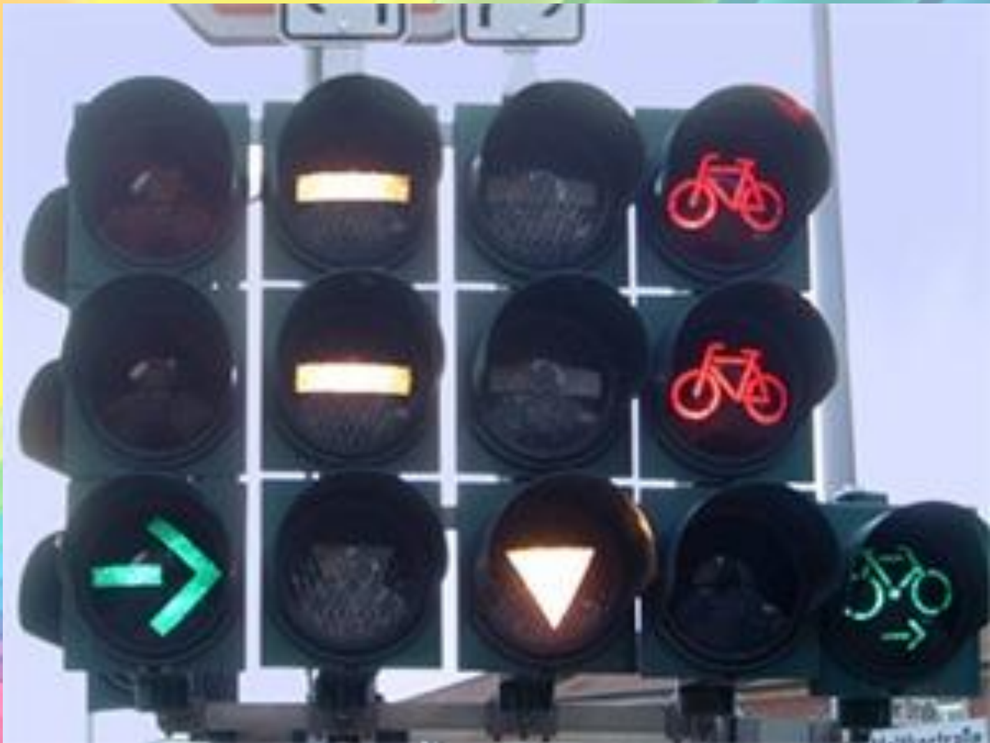
Светофор для велосипедов в Вене