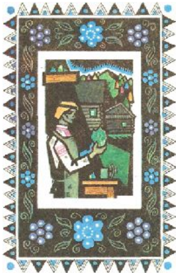
Данило-мастер. Художник А.Белюкин

Сказ — устное слово, устная форма речи, перенесенная в книгу.