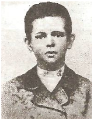
Бажов в детстве