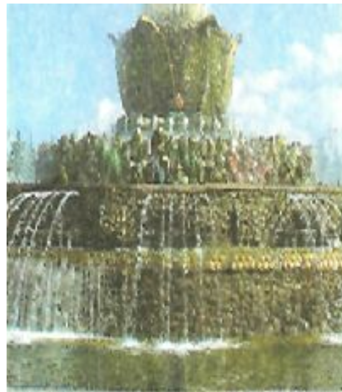
Фонтан «Каменный цветок». Москва. ВВЦ. Архитектор К.Топуридзе

В Москве есть улица Бажова, а рядом с бажовской — Малахитовая. На ВВЦ можно видеть фонтан «Каменный цветок». Есть даже теплоход «Павел Бажов». На родине Бажова в Сысерти и в Екатеринбурге работают музеи П.П. Бажова, ему поставлены памятники.