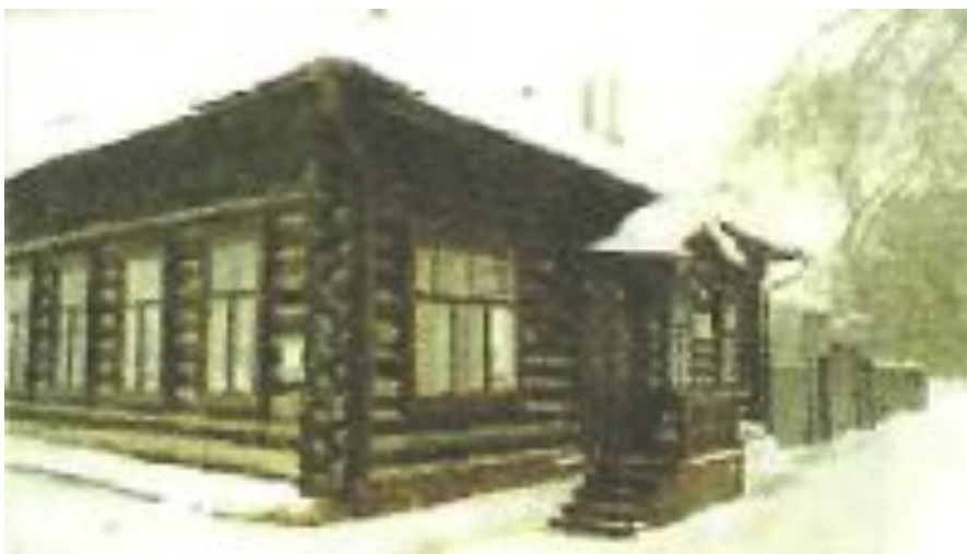
Дом-музей П.П.Бажова в Екатеринбурге

В Москве есть улица Бажова, а рядом с бажовской — Малахитовая. На ВВЦ можно видеть фонтан «Каменный цветок». Есть даже теплоход «Павел Бажов». На родине Бажова в Сысерти и в Екатеринбурге работают музеи П.П. Бажова, ему поставлены памятники.