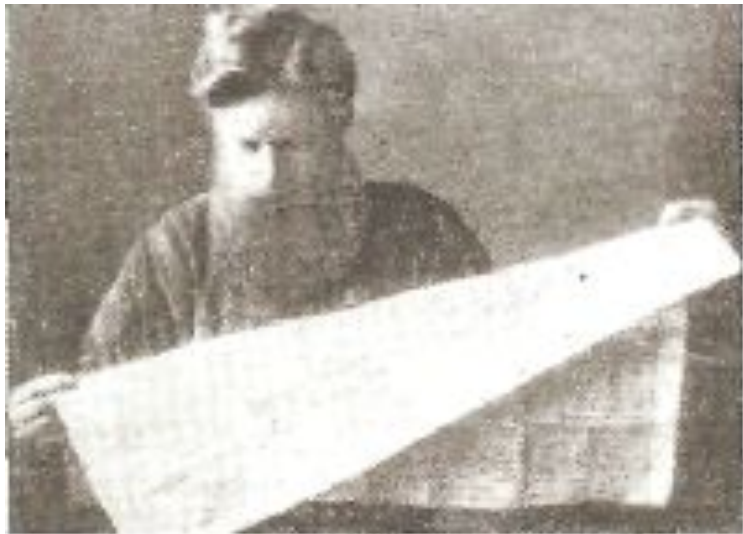
П.П.Бажов читает крестьянское письмо

Одновременно с учительской работой Павел Петрович много занимается изучением фольклора и этнографии, истории родного уральского края. К этому же времени относится и его первая публикация в «Екатеринбургских епархиальных новостях». События революции и Гражданской войны не оставили Бажова в стороне. Он вступает в Красную Армию, а после войны становится журналистом.