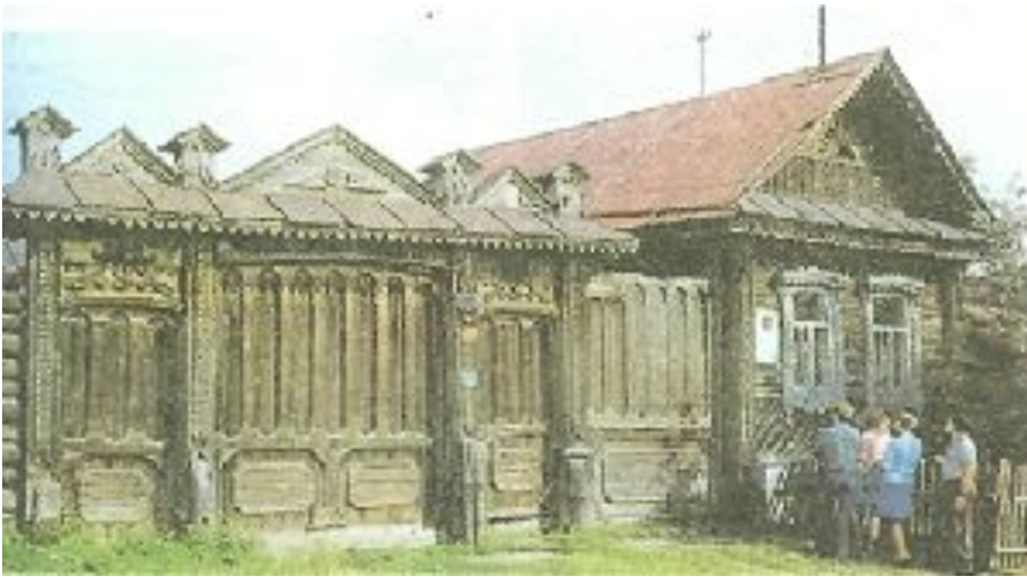
Дом П.П.Бажова в Сысерти

Павел учился в земской трёхлетней школе. Был способным и любознательным учеником. Родители, люди небогатые, всё же нашли возможность продолжить обучение сына в уездном городе — Екатеринбурге.