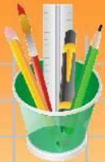
Таблица умножения на 2, 3, 4, 5

Автор: Беляева Ольга Борисовна, учитель начальных классов МБОУ «Стрелецкая СОШ», Тамбовский район, Тамбовская область