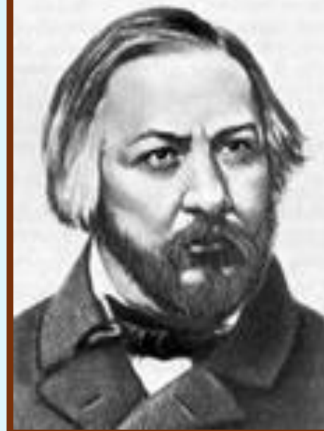
ГЛИНКА МИХАИЛ ИВАНОВИЧ