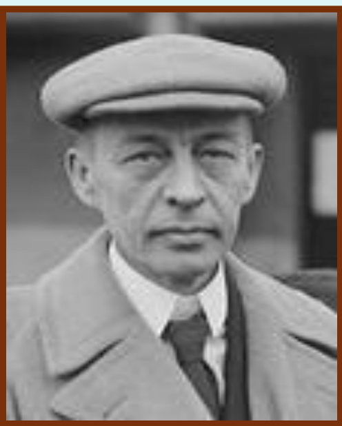
РАХМАНИНОВ СЕРГЕЙ ВАСИЛЬЕВИЧ