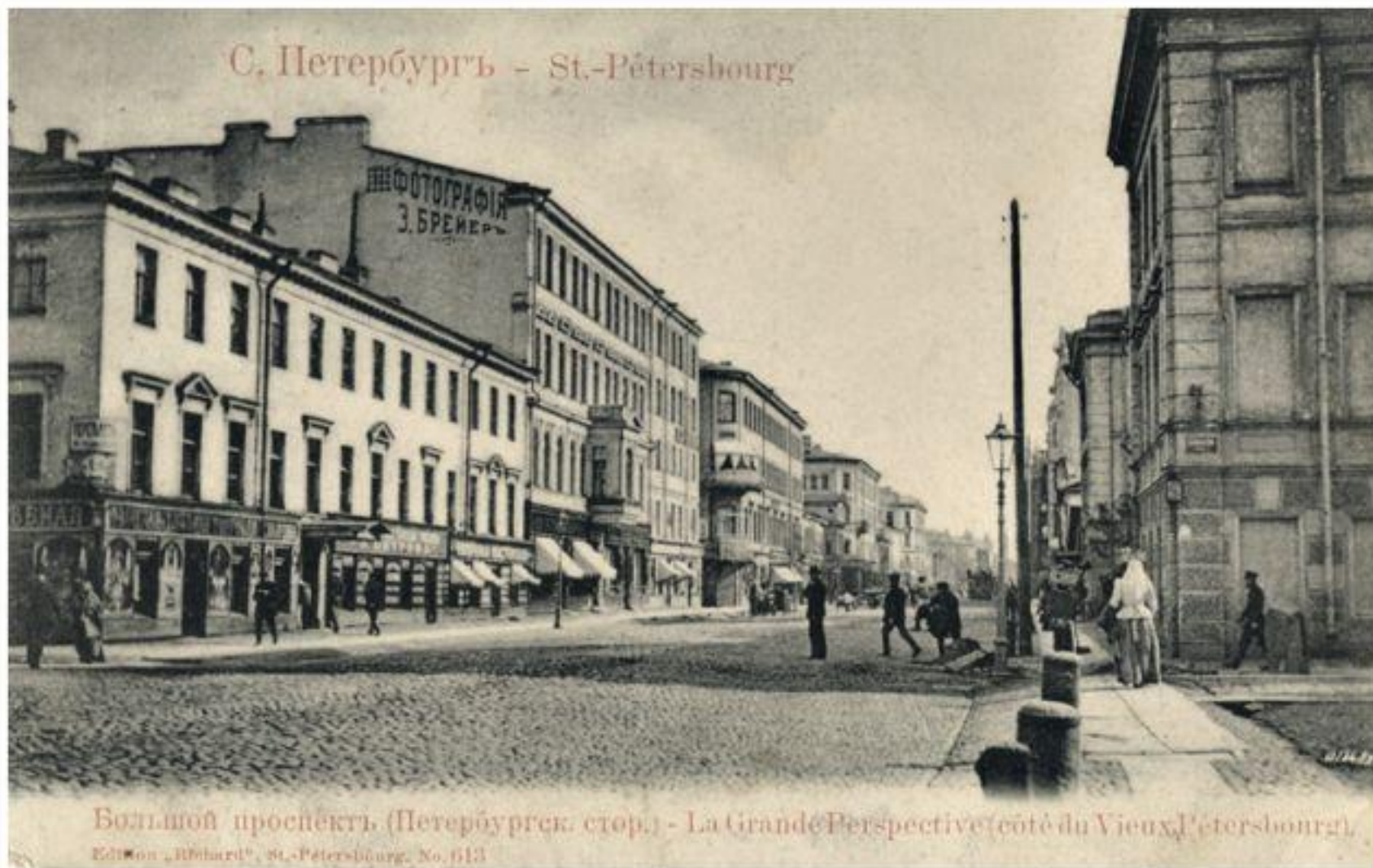
Большой проспект (Петербургск. стор.) - La Grande Perspective (côté du Vieux-Petersbourg).

Ed. Mon. «Hilbard», St.-Petersbourg, No. 613