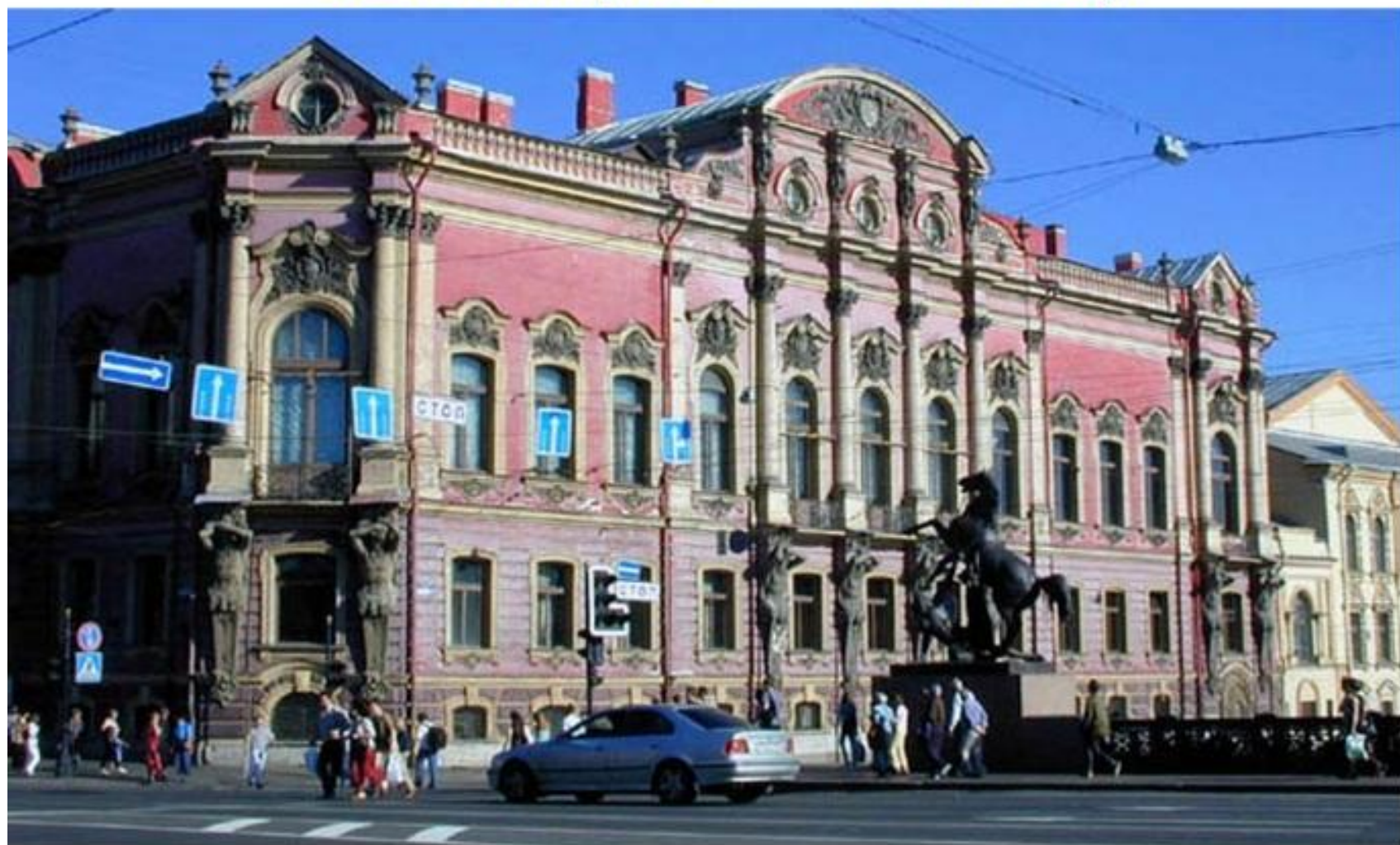
Частный дом-дворец Белосельских-Белозерских в Санкт-Петербурге