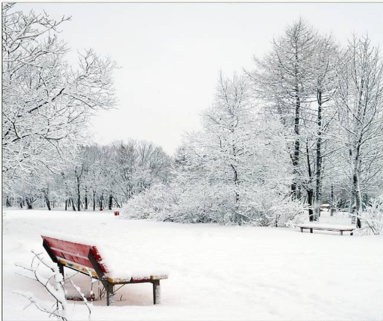
Nikolay V Ushakov (1881)