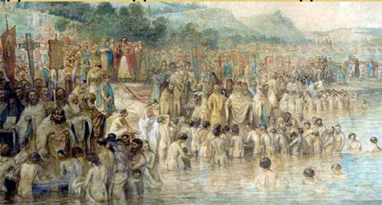
«Крещение Руси» В. Г. Перов

Крещение сопровождалось учреждением церковной иерархии. Русь стала одной из митрополий (Киевской) Константинопольского патриархата. Епархия была создана также в ...ве.