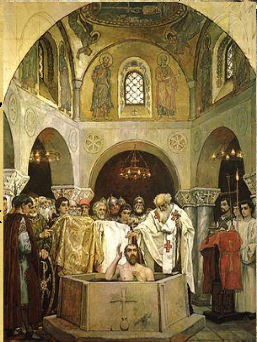
Фреска «Крещение князя Владимира». В. М. Васнецов

В крещении Владимир принял имя Василий , до крещения известен был как «великий распутник», имевший несколько сот наложниц и состоявший в нескольких официальных языческих браках. После крещения Владимир состоял предположительно в двух последовательных христианских браках.