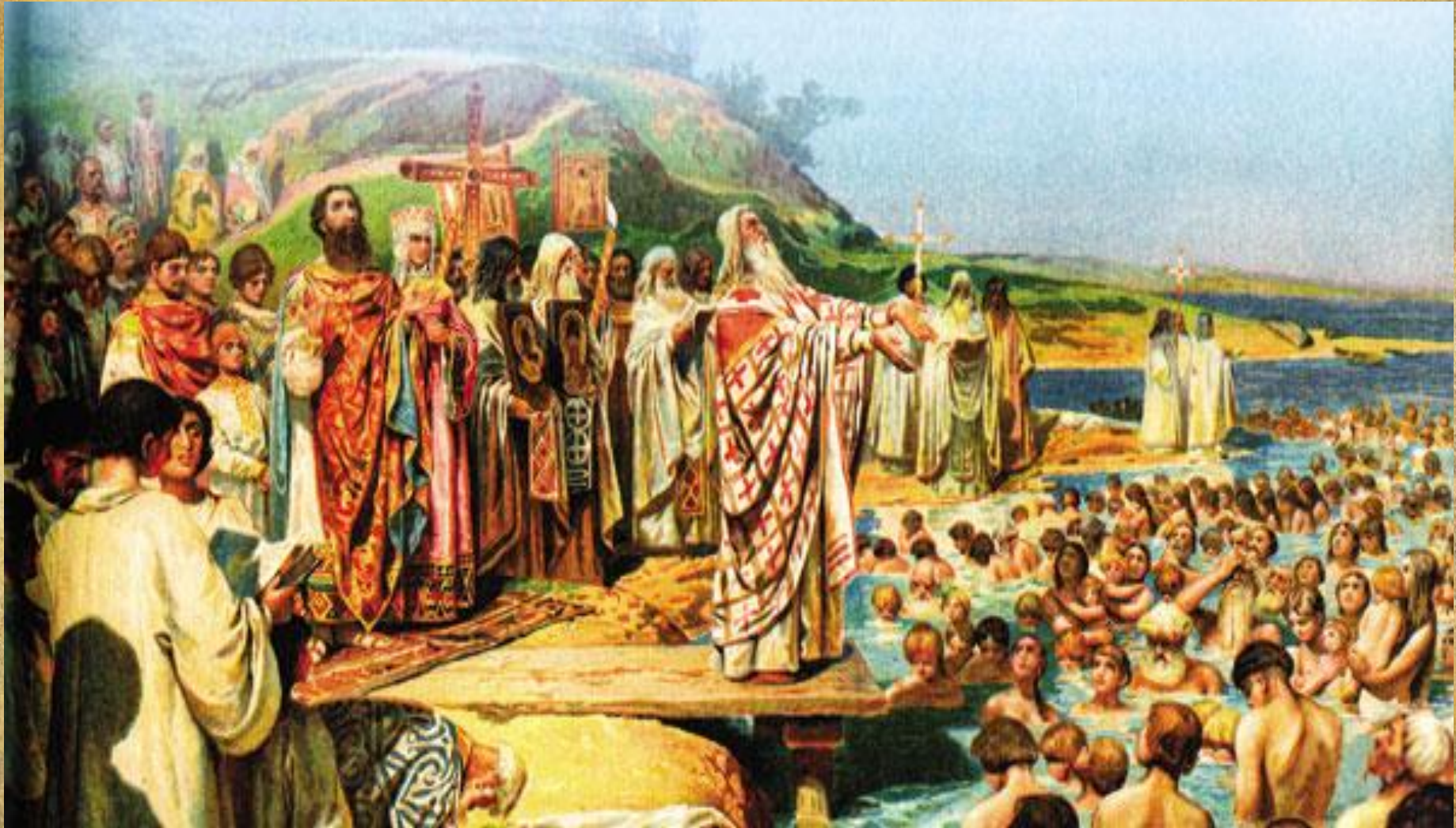
К. В. Лебедев «Крещение киевлян»