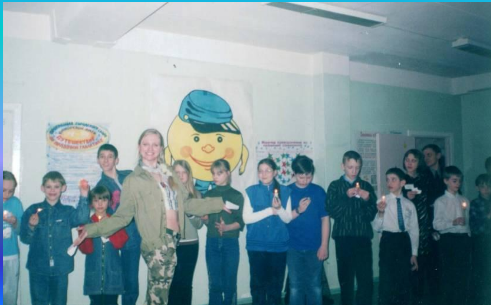
Городской коммунарский сбор Юниорской Лиги в школе № 17