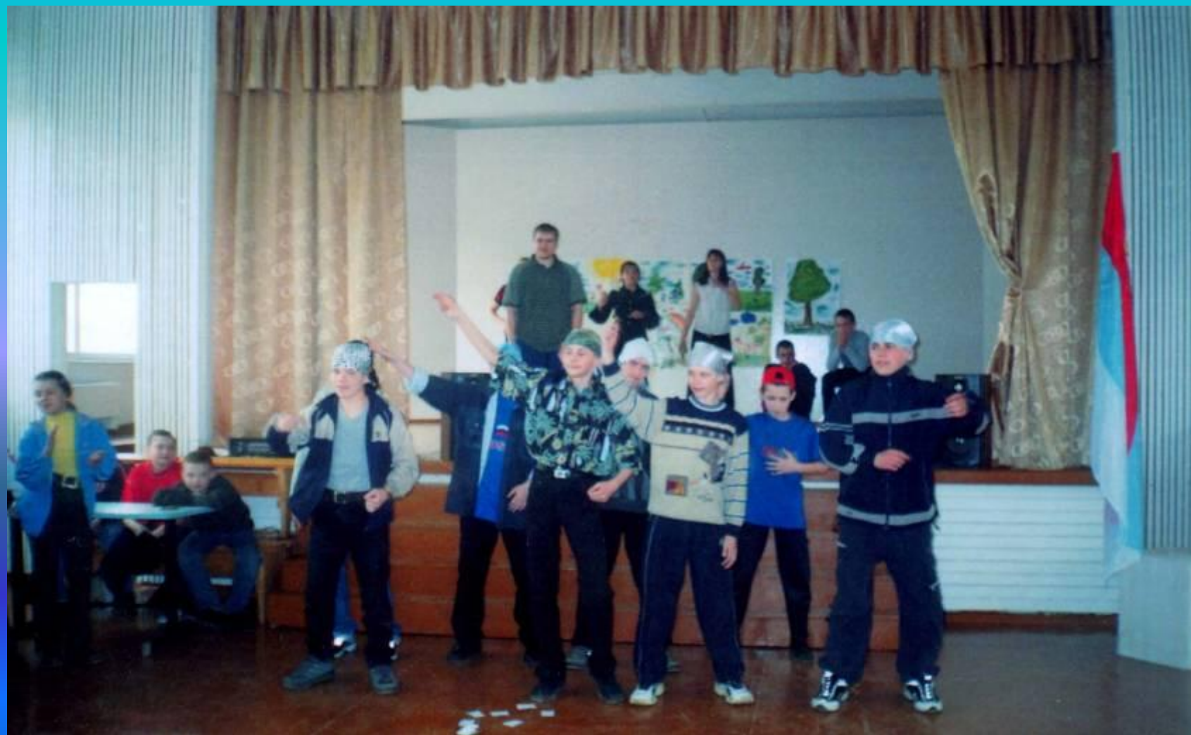
Коммунарский сбор по теме «Земля – наш общий дом» в школе №1