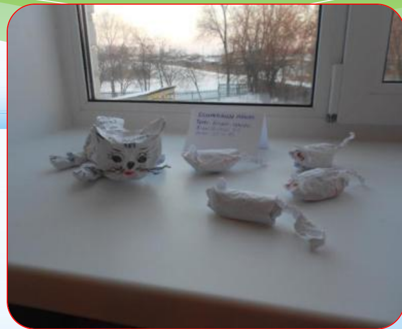
«Кошки – мышки»