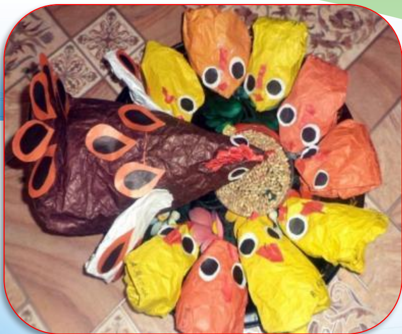
* «Курочка с цыплятами»