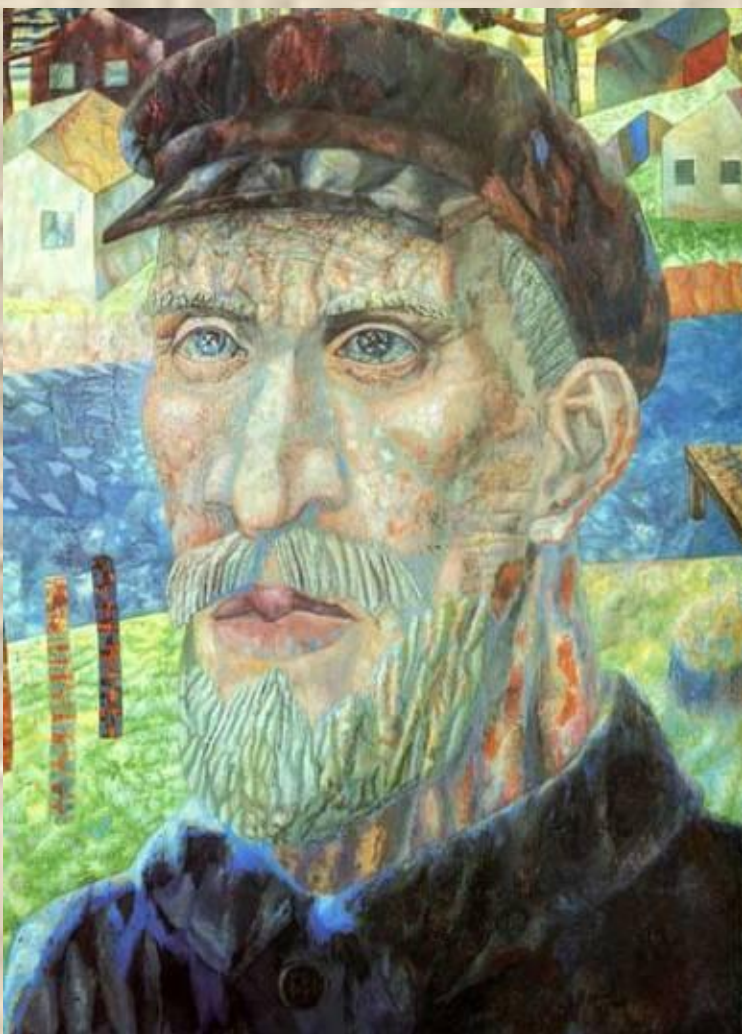
Колхозник, 1931 Масло на холсте. Русский музей