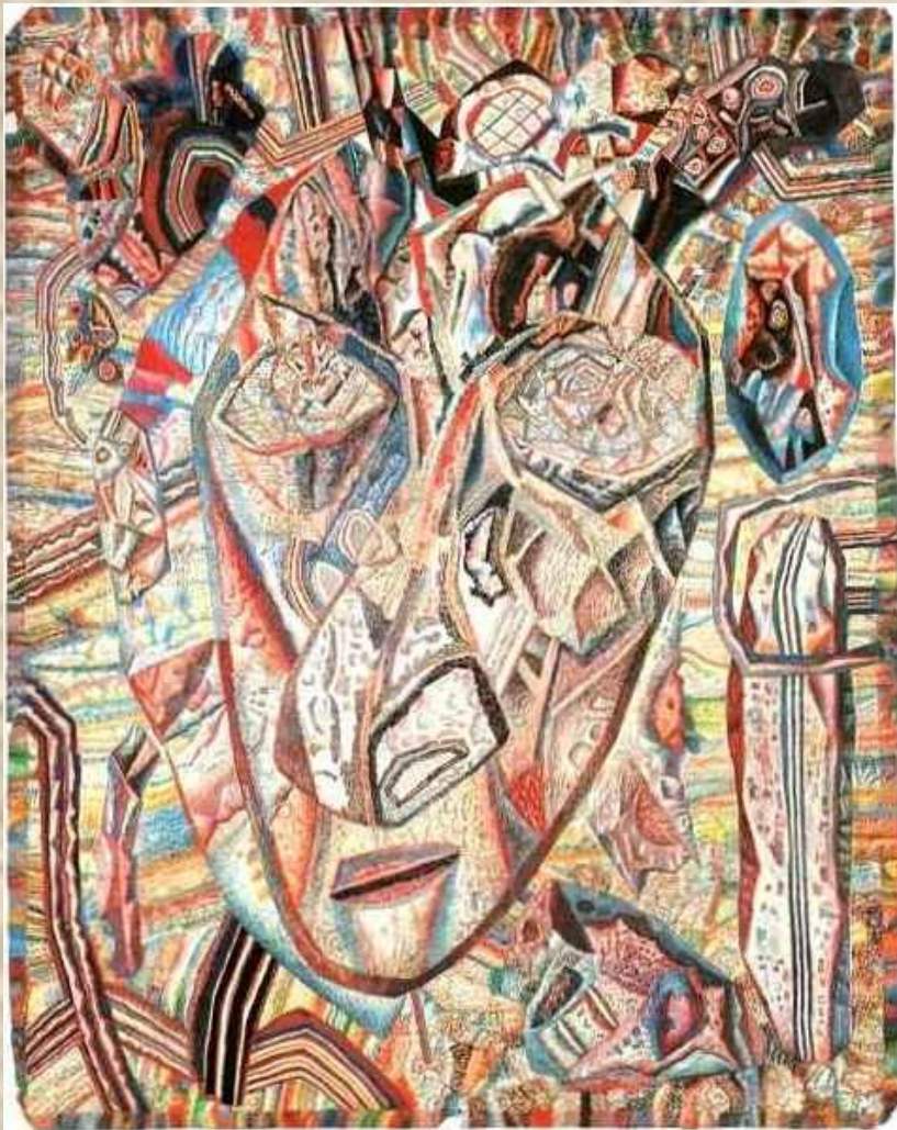
Голова. 1924 Музей Людвига. Германия