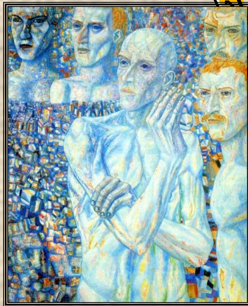
Человек во вселенной. 1925 Масло на бумаге. Русский музей