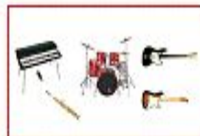
Джаз-рок фьюжн бэнд