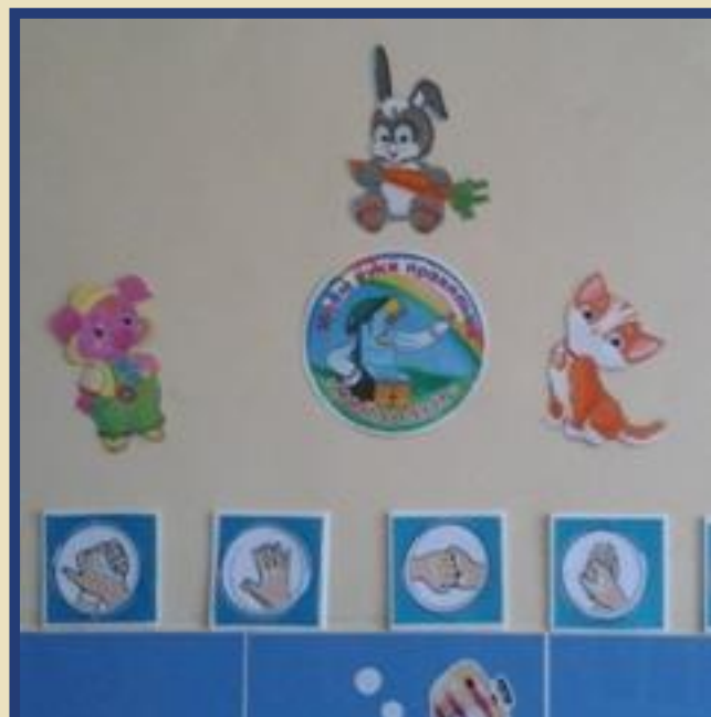
Оформление умывальной комнаты