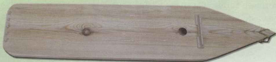
Дощатая цитра (манси)

Известно, что этот инструмент шаманы никогда не продавали, считая, что продав его, продаешь свою душу.