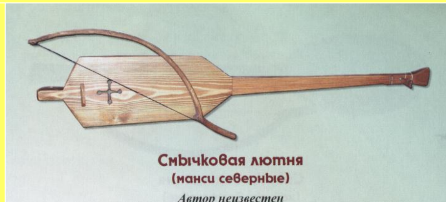
Смычковая лютня (манси северные)