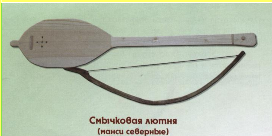
Смычковая лютня (манси северные)

Однострунные, двухструнные смычковые коробчатые лютни. Северные манси называли – нэрнэ йив.