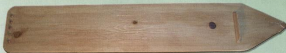
Дощатая цитра (манси)

Северные манси называли этот инструмент санквылтап