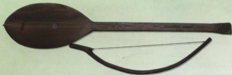
Смычковая лютня (ханты восточные)

При игре инструмент держат вертикально на колене и водят смычком по струнам