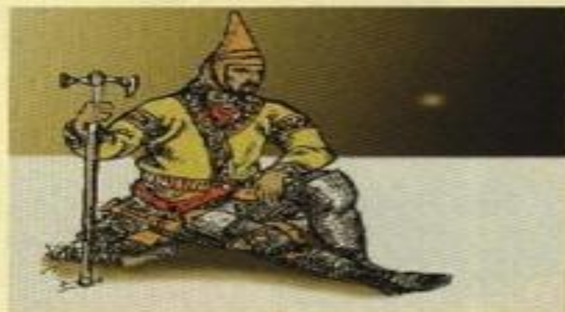
Сакский воин. По реконструкции М.В. Горелика