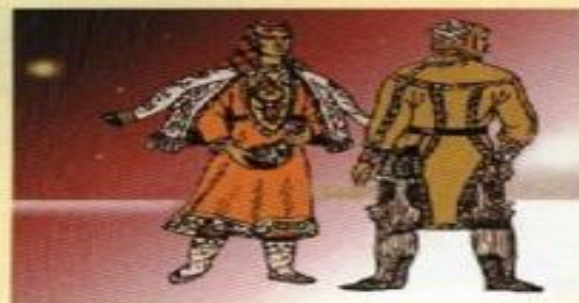
Саки. По реконструкции М.В. Горелика