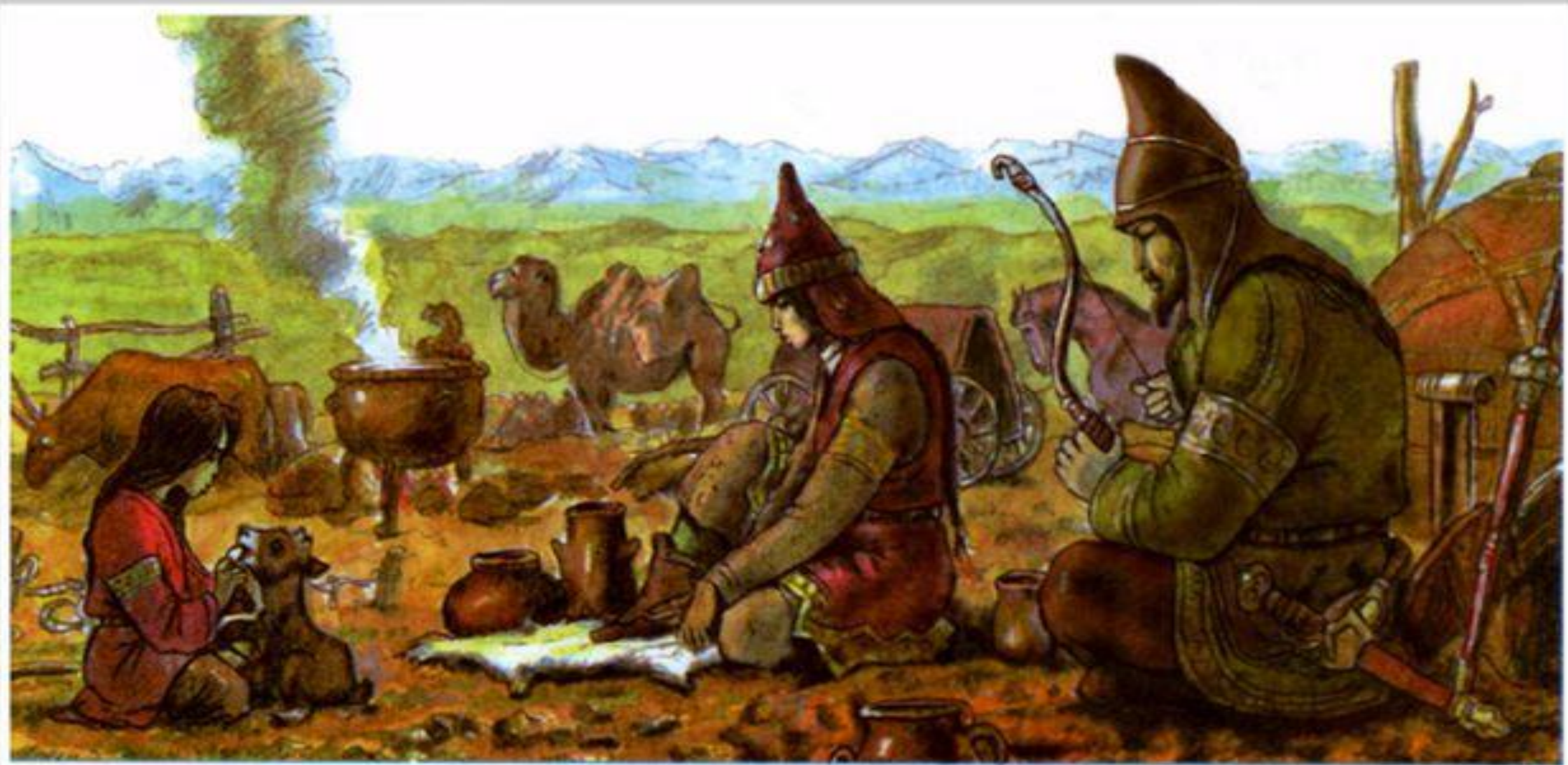
Повседневная жизнь саков.