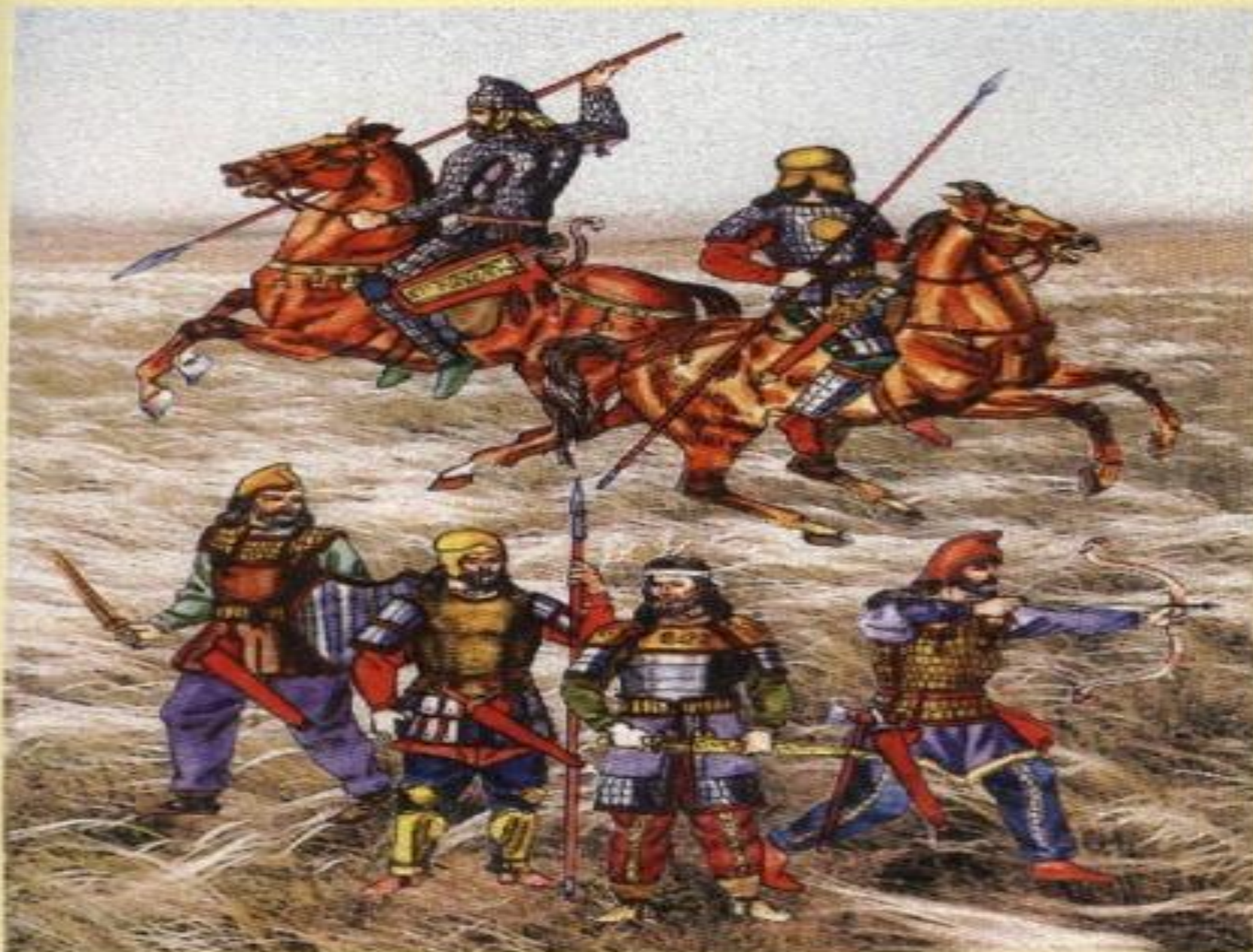
Сакские воины. По реконструкции К.С. Ахметжанова