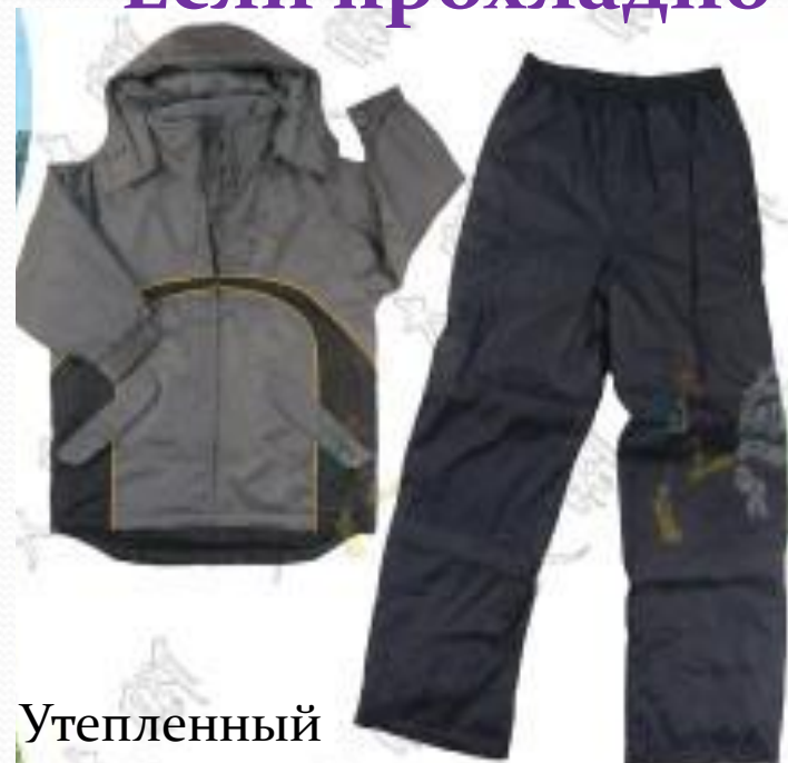
Утепленный ветрозащитный костюм