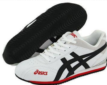
Кроссовки или спортивные тапочки