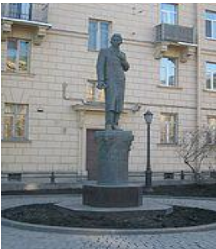
Казанда Тукай һәйкәле