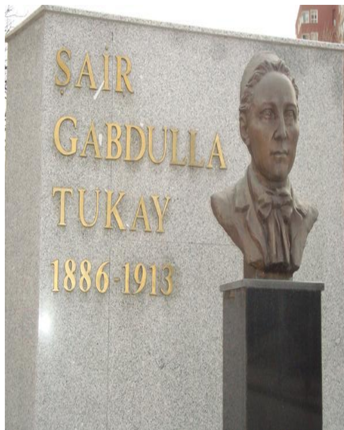
Төркия башкаласы Анкара шәһәрндә татар шагыйре Габдулла Тукайга һәйкәл 2011 елның 26 маенда ачылды. Ул Анкараның 2000нче еллар башында Габдулла Тукай исеме бирелгән урамында куелды.