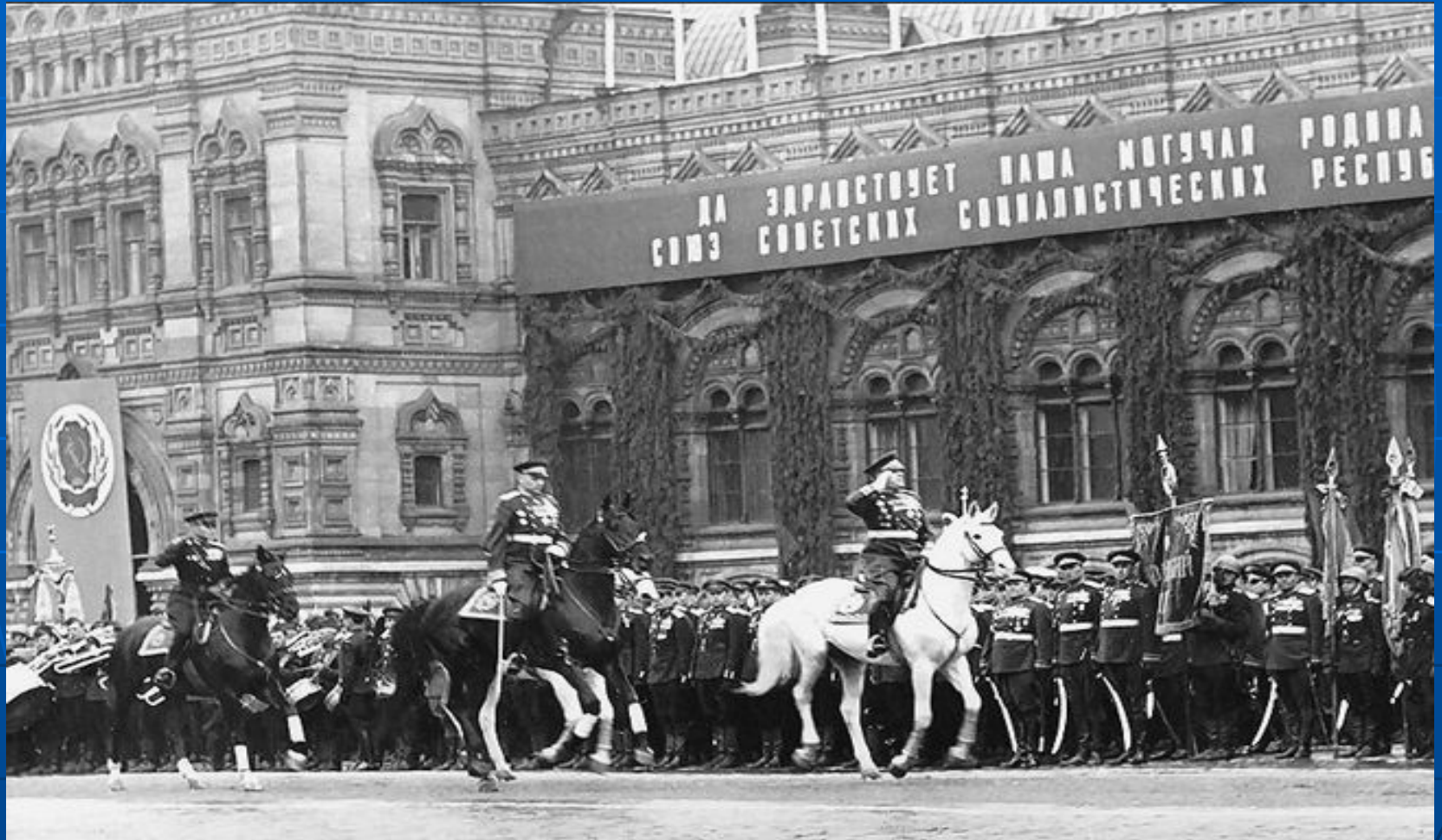
Парад Победы. Маршалы Советского Союза Г.К.Жуков и Г.К. Рокоссовский. 24 июня 1945 года. Красная площадь.