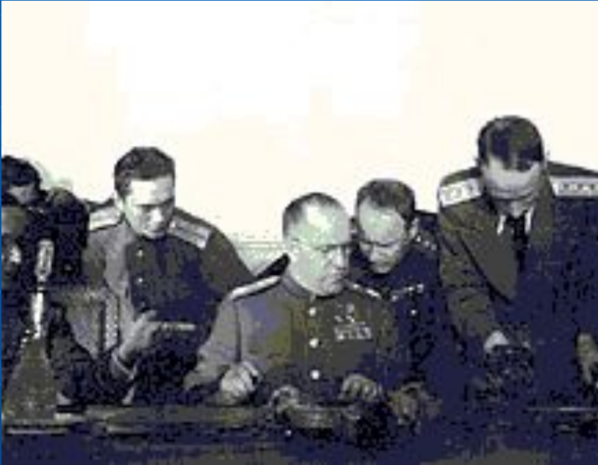
Г.К.Жуков подписывает Акт о безоговорочной капитуляции фашистской Германии. 9 мая 1945 года