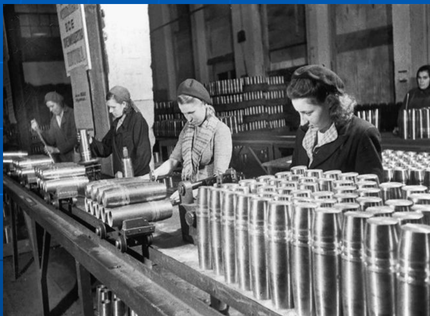
На артиллерийском заводе