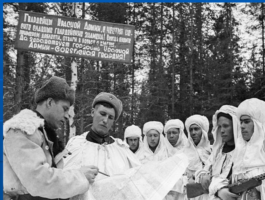
Разведчики получают боевое задание