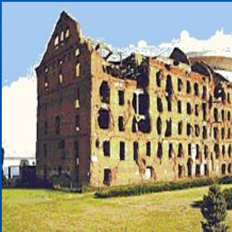
Волгоград. Дом Павлова.