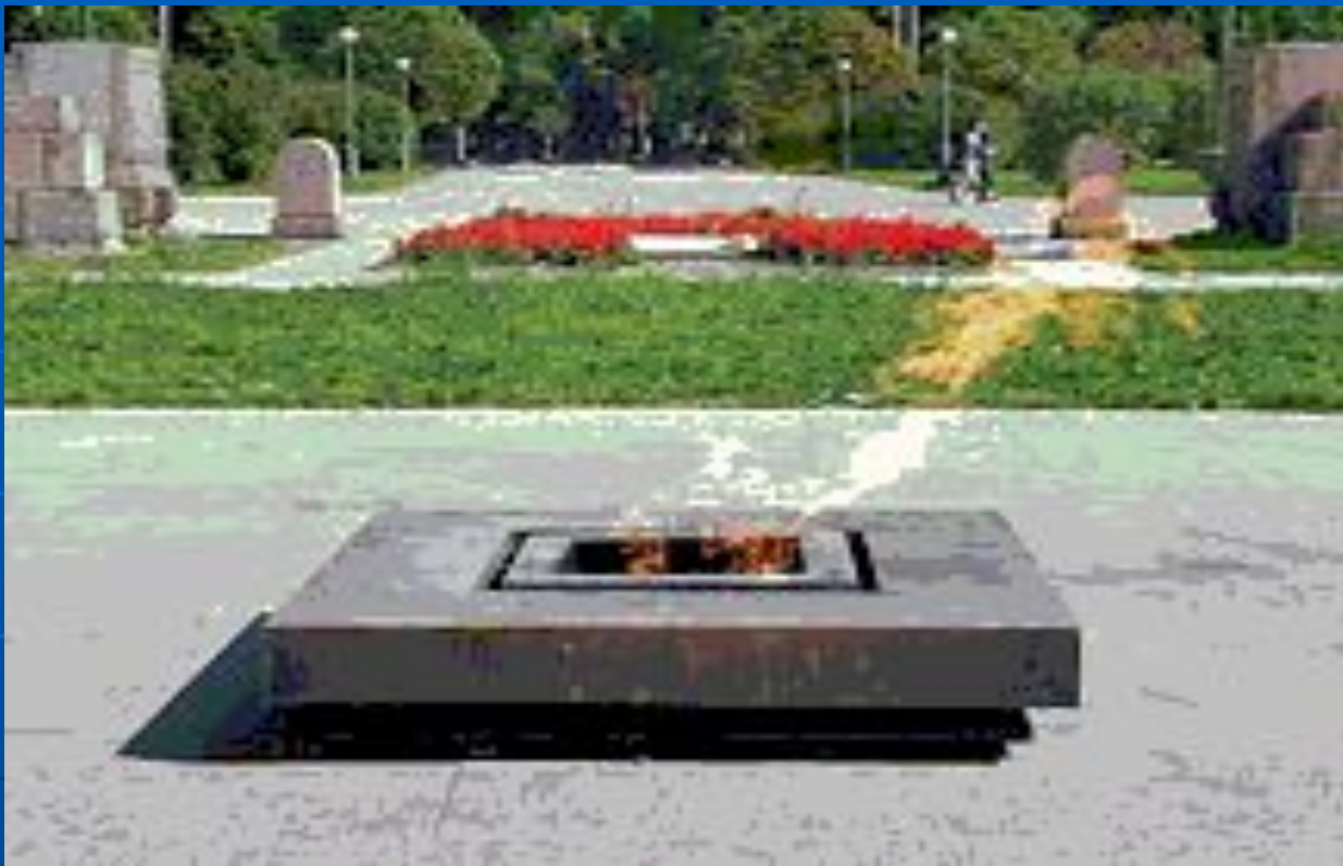
Вечный огонь на Марсовом поле. Санкт – Петербург.