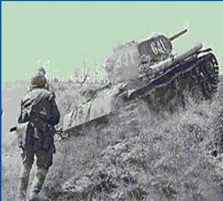
Курская битва. Пехота идёт в атаку под прикрытием танков