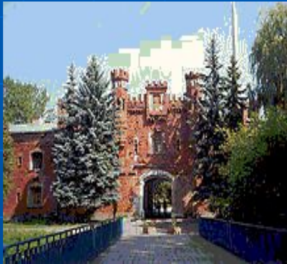
Брестская крепость. Холмский ворота.