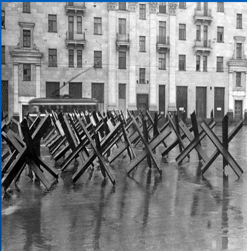
Противотанковые ежи на улицах Москвы