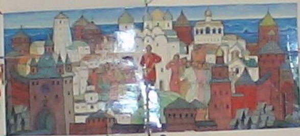
"Мы живём в России, в городе Великом"