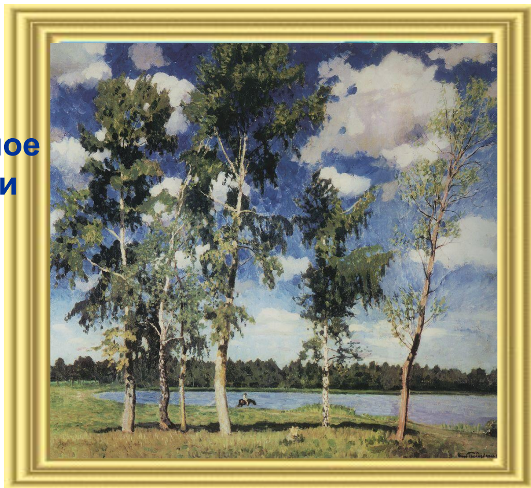
«На озере» Художник И.Э. Грабарь