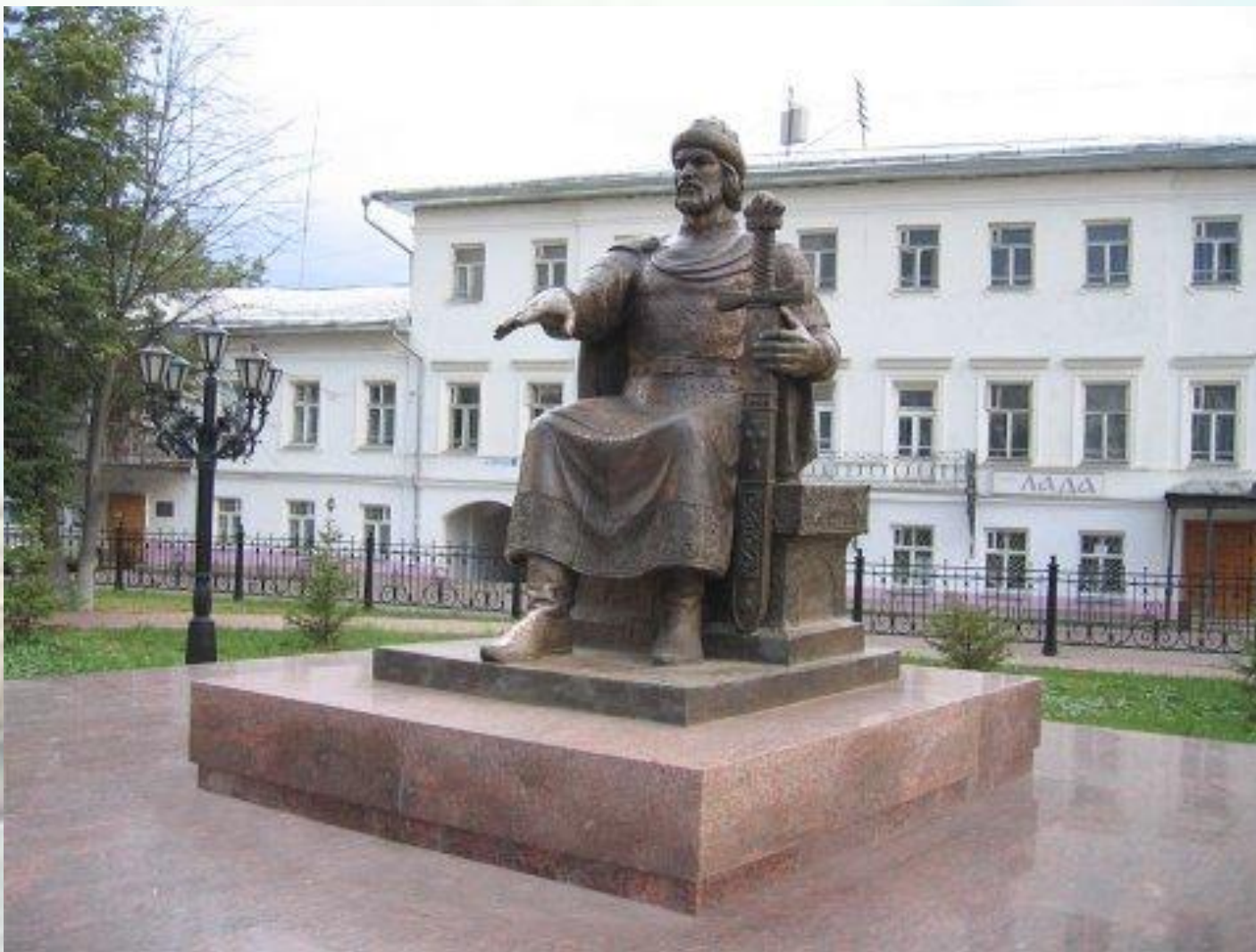
Памятник Юрию Долгорукому