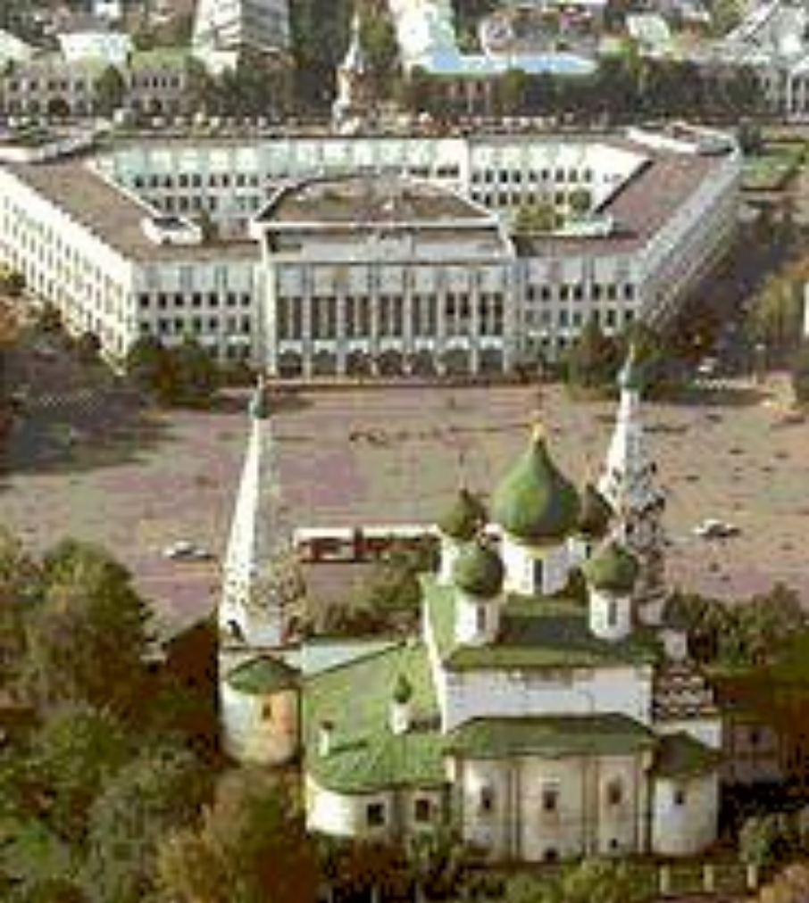
Панорама города с видом на церковь Ильи Пророка