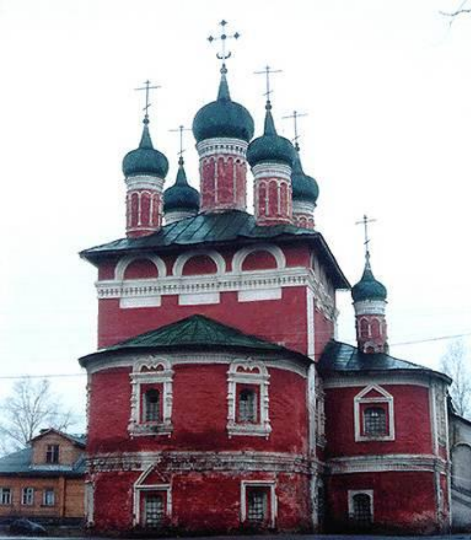
Смоленская церковь Иоанна Предтечи