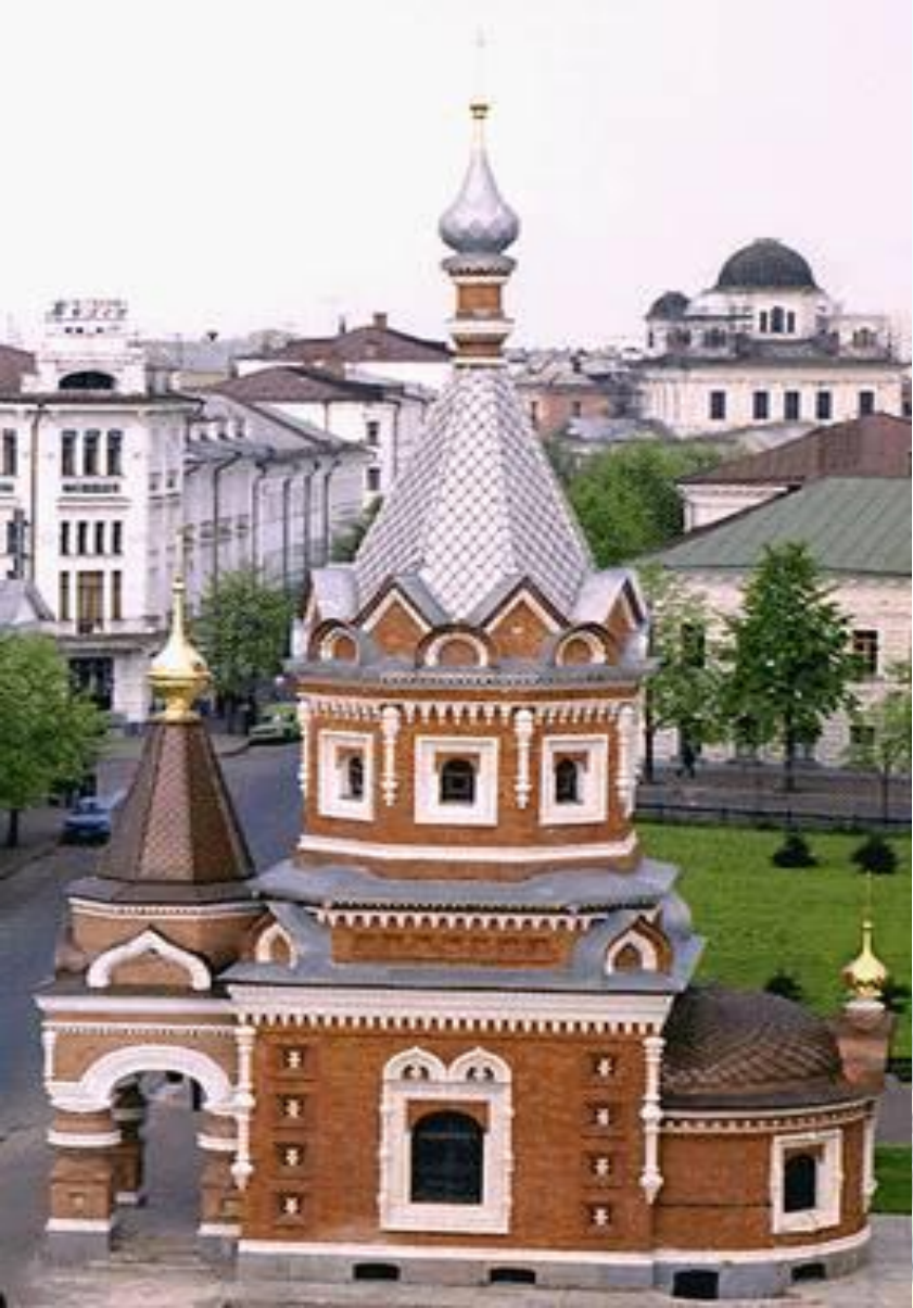
Часовня Александра Невского