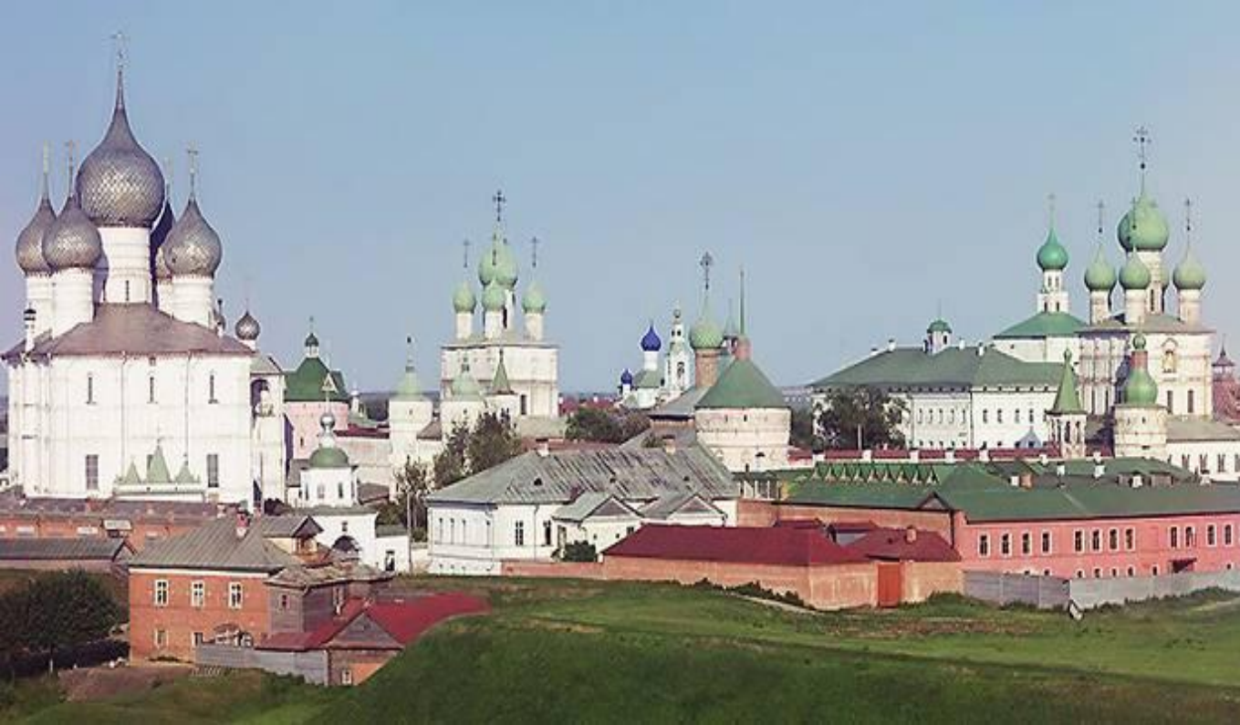
Вид на кремль