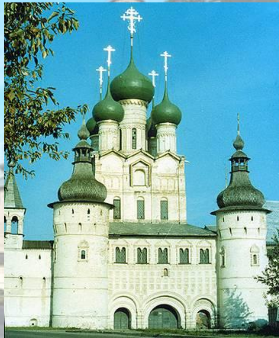
Церковь Иоанна Богослова