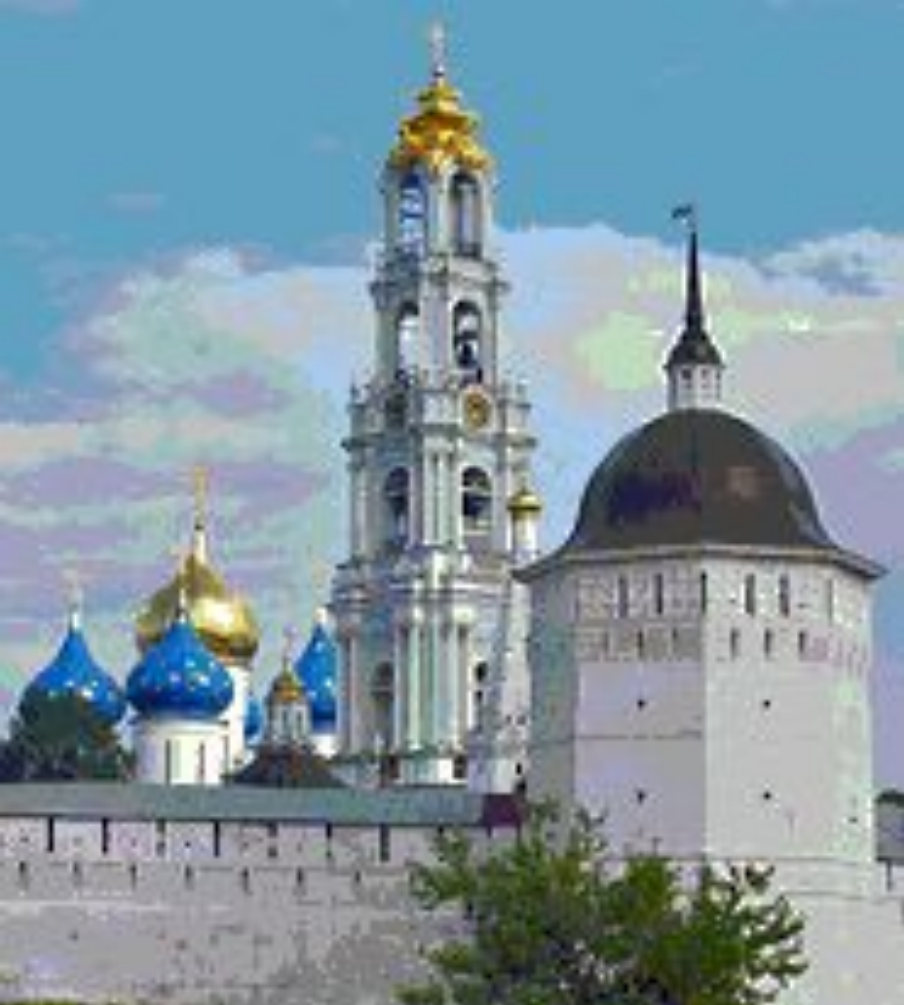
Панорама Троице-Сергиевой лавры