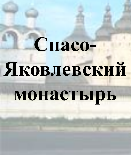
Спасо- Яковлевский монастырь