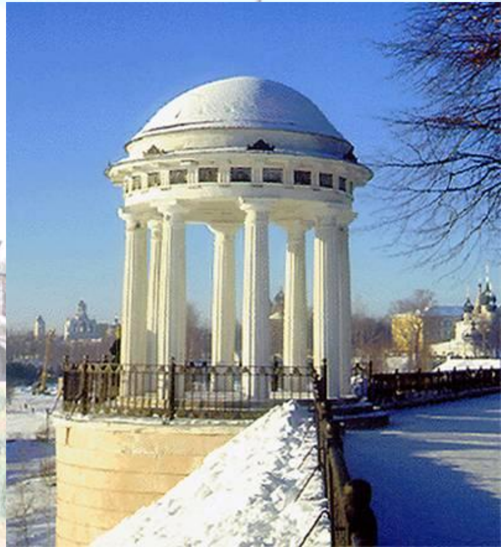
Беседка Николая Островского