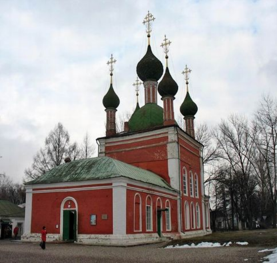
Церковь Александра Невского