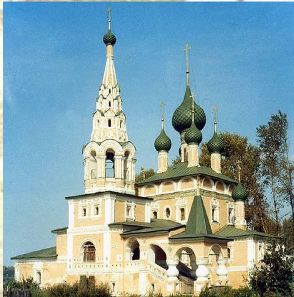
Церковь Иоанна Предтечи