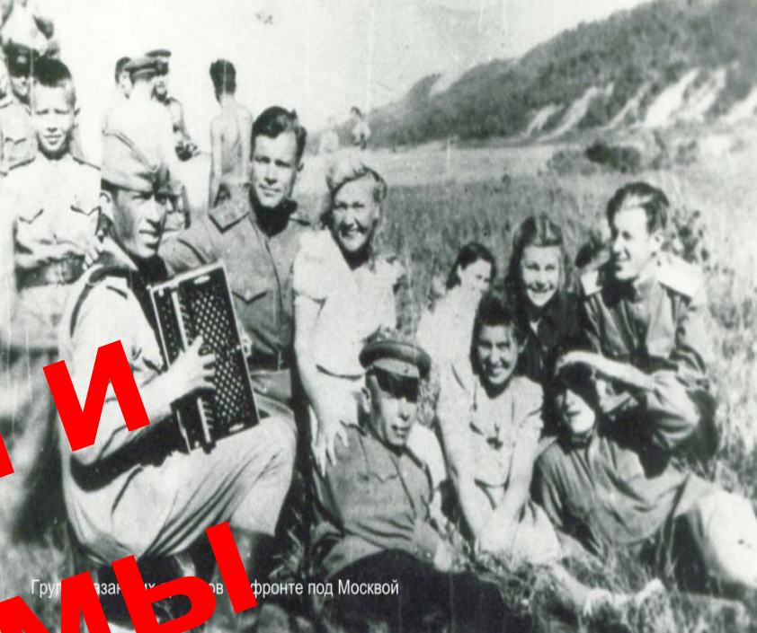
Группа солдат и граждан в тылу на фронте под Москвой