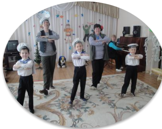
Матросский танец «Яблочко»