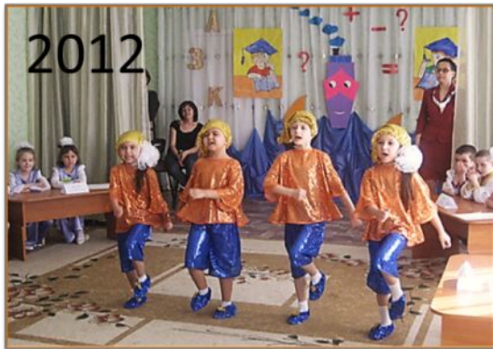
Интеллектуальная игра «Что, где, когда?»