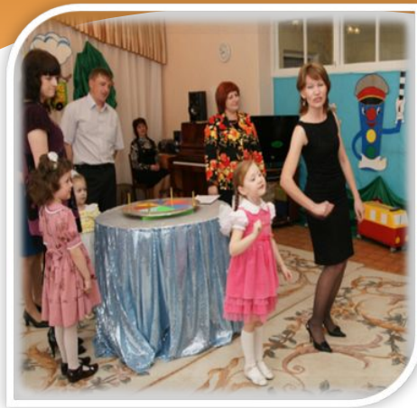
Конкурс «Поле чудес»