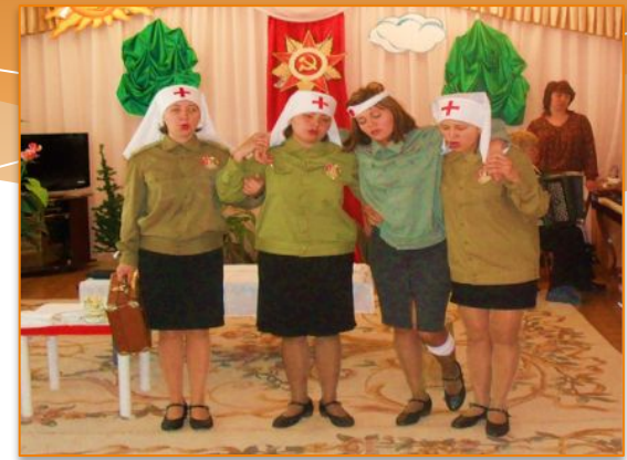
Инсценированная песня «Конь» муз. Ю.Морозова.