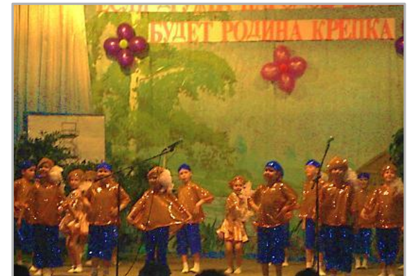
Участие в творческом отчете сельских поселений.