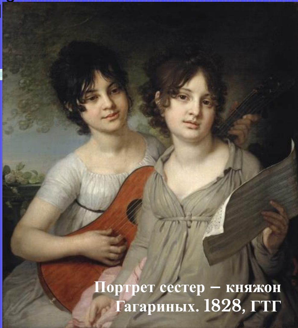
Портрет сестер – княжон Гагариных. 1828, ГТГ

В начале 1790-х Боровиковский обратился к жанру камерного портрета, чаще всего изображая женщин в домашней обстановке.