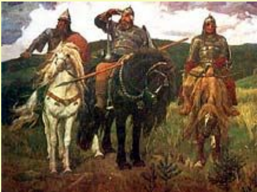
«Три богатыря» («Богатыри») Виктор Михайлович Васнецов 1881-1898