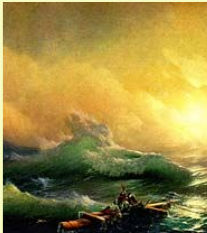
«Девятый вал» Иван Константинович Айвазовский 1850