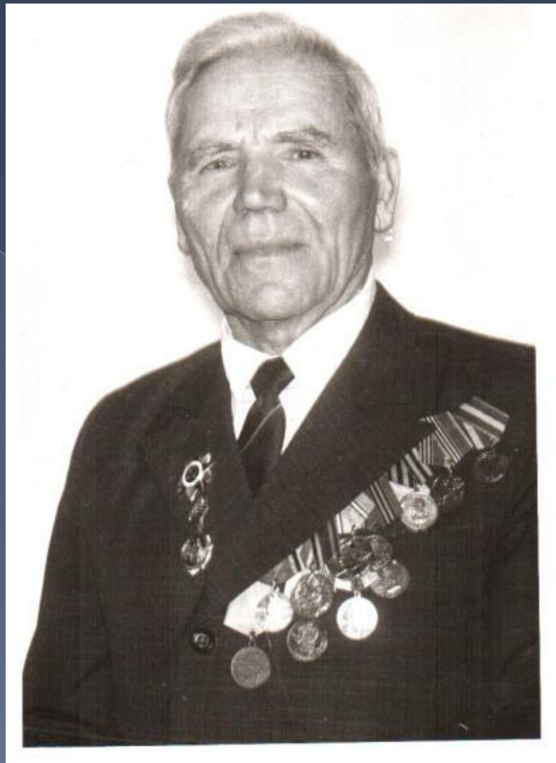
АЛЕКСАНДР ПАНТЕЛЕЕВИЧ МИНЕНКО (1919)