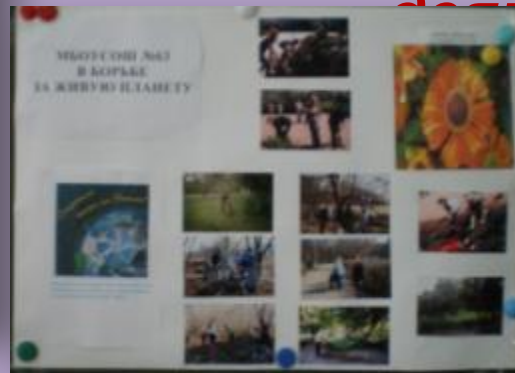
Проект «День Земли»