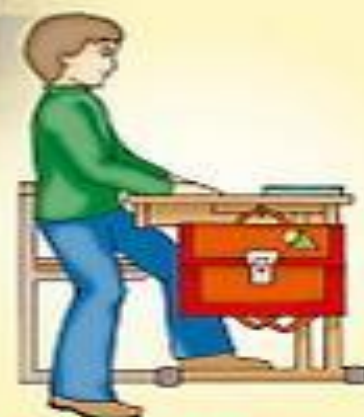
Выход из-за парты