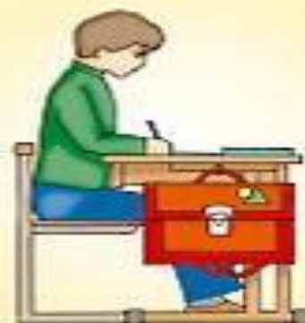
Посадка при письме