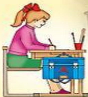
Посадка при чтении и ручных работах