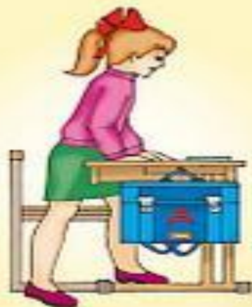
Посадка за парту