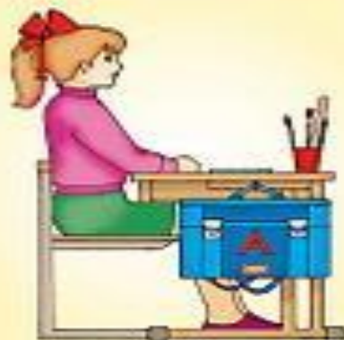
Посадка "готов к работе"