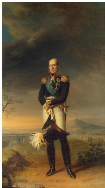
М. Барклай де Толли