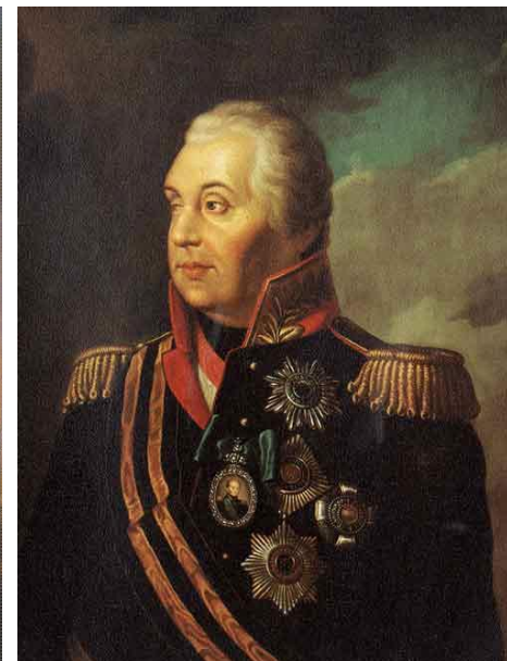
М. И. Кутузов