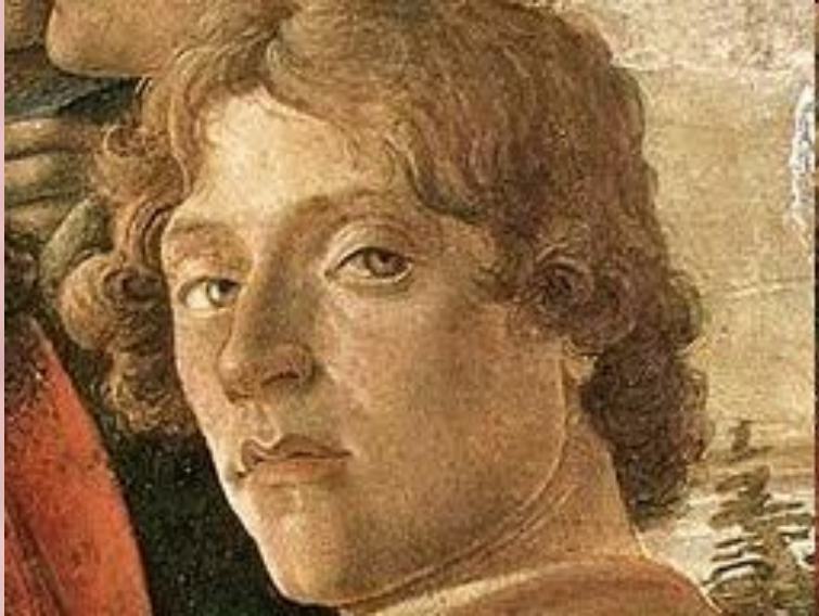
Сандро Боттичелли (1445-1510)

Итальянский живописец эпохи Раннего Возрождения. Был близок двору Медичи и гуманистическим кругам Флоренции. Большую часть своих произведений выполнил для домов флорентийской знати, а также для монастырей, церквей и общественных зданий Флоренции. В числе других живописцев расписывал фресками Сикстинскую капеллу в Ватикане. Создавал алтарные образы, исполнил большое количество картин с изображением мадонны. Помимо религиозных композиций писал мифологические картины и аллегории, работал в жанре портрета. Выполнил серию рисунков к «Божественной комедии» Данте. В 1490-е гг., в период потрясших Флоренцию социальных движений и мистических проповедей монаха Савонаролы, в искусстве Боттичелли появляются морализаторские нотки, драматизм и религиозная экзальтация.