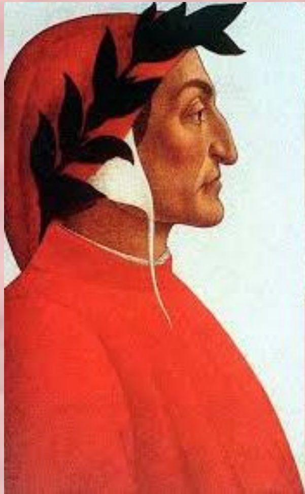
Данте Алигьери (1265-1321)

/. Назовите автора произведения « Божественная комедия »