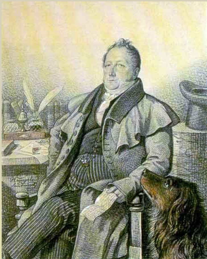
Г.Кампельон С.Л. Пушкин. 1824.

В их доме собирались поэты, художники, музыканты.