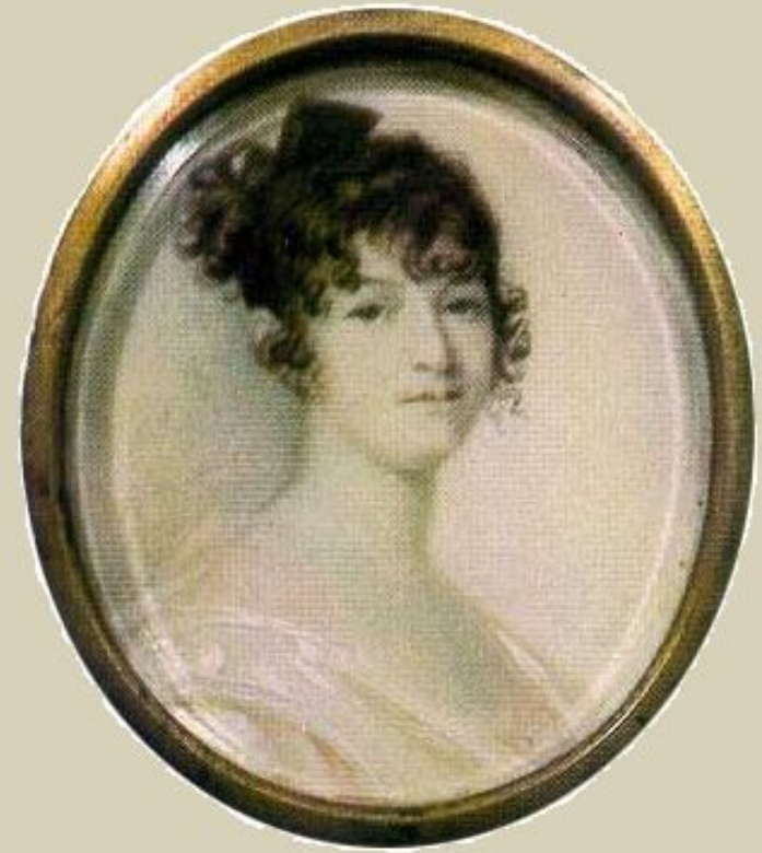
Миниатюра Ксавье де Местра. Н.О. Пушкина. 1800-е гг.

Отец Пушкина Сергей Львович и мать Надежда Осиповна были дальними родственниками - троюродные брат и сестра.