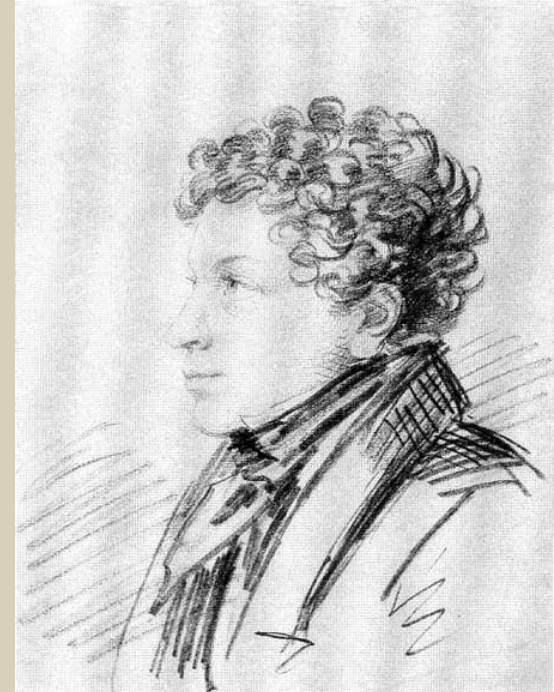
А.О. Орловский Л.С. Пушкин. Первая половина 1820-х гг.

Любовь ему компенсировала знаменитая няня Арина Родионовна