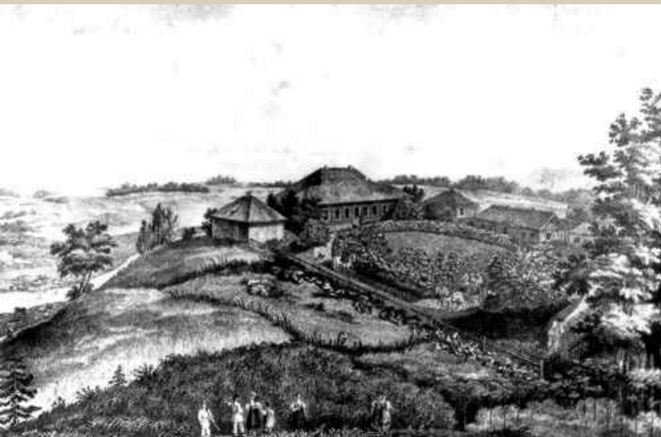
П.А. Александров с оригинала И.С. Иванова 1837. Михайловское. Вид усадьбы.