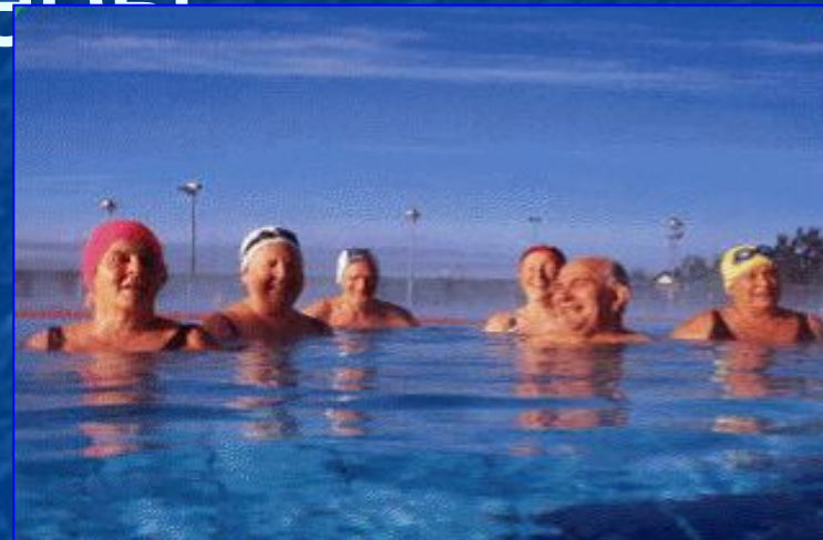
Группа пожилых людей в открытом бассейне