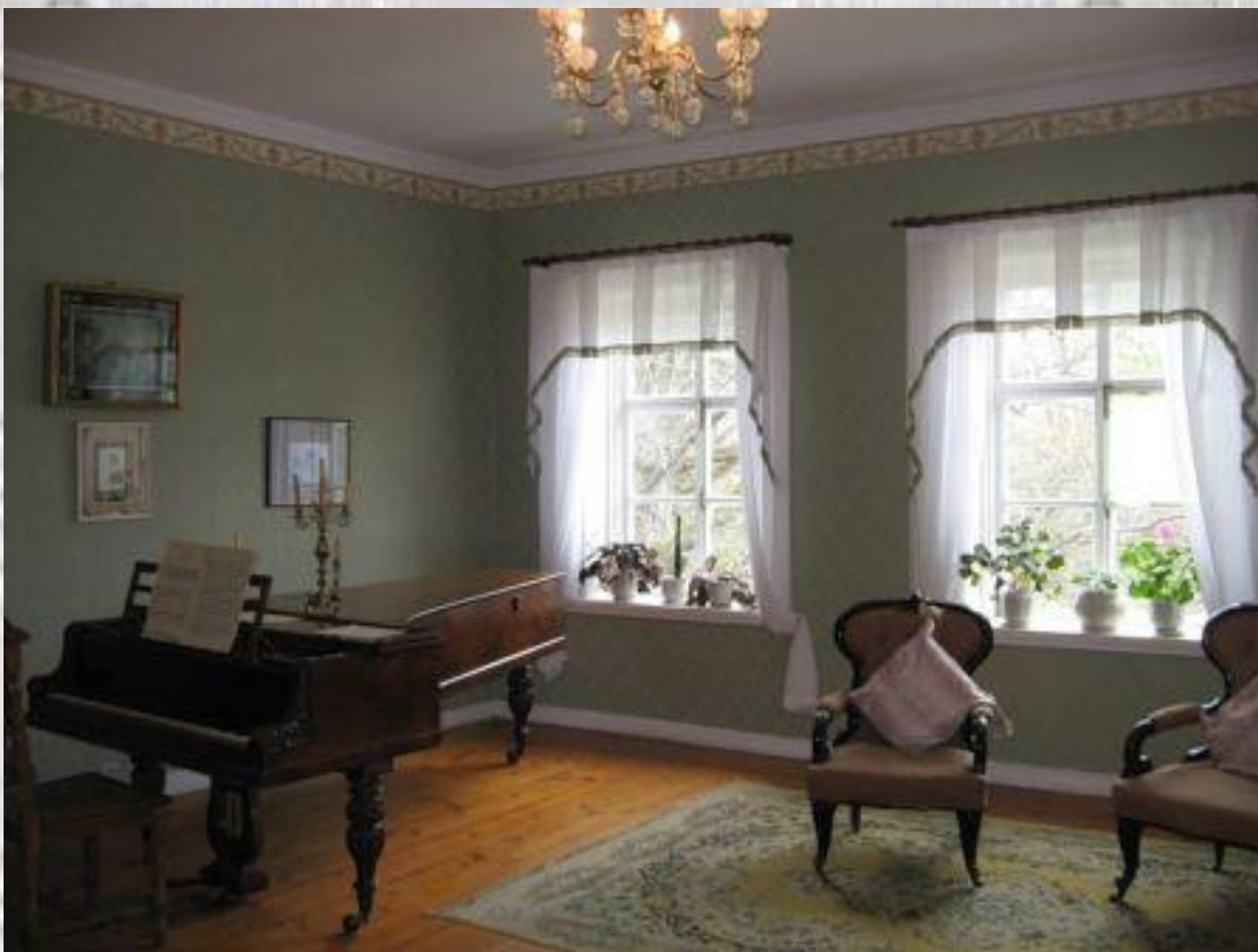
На 2 этаже спальня композитора