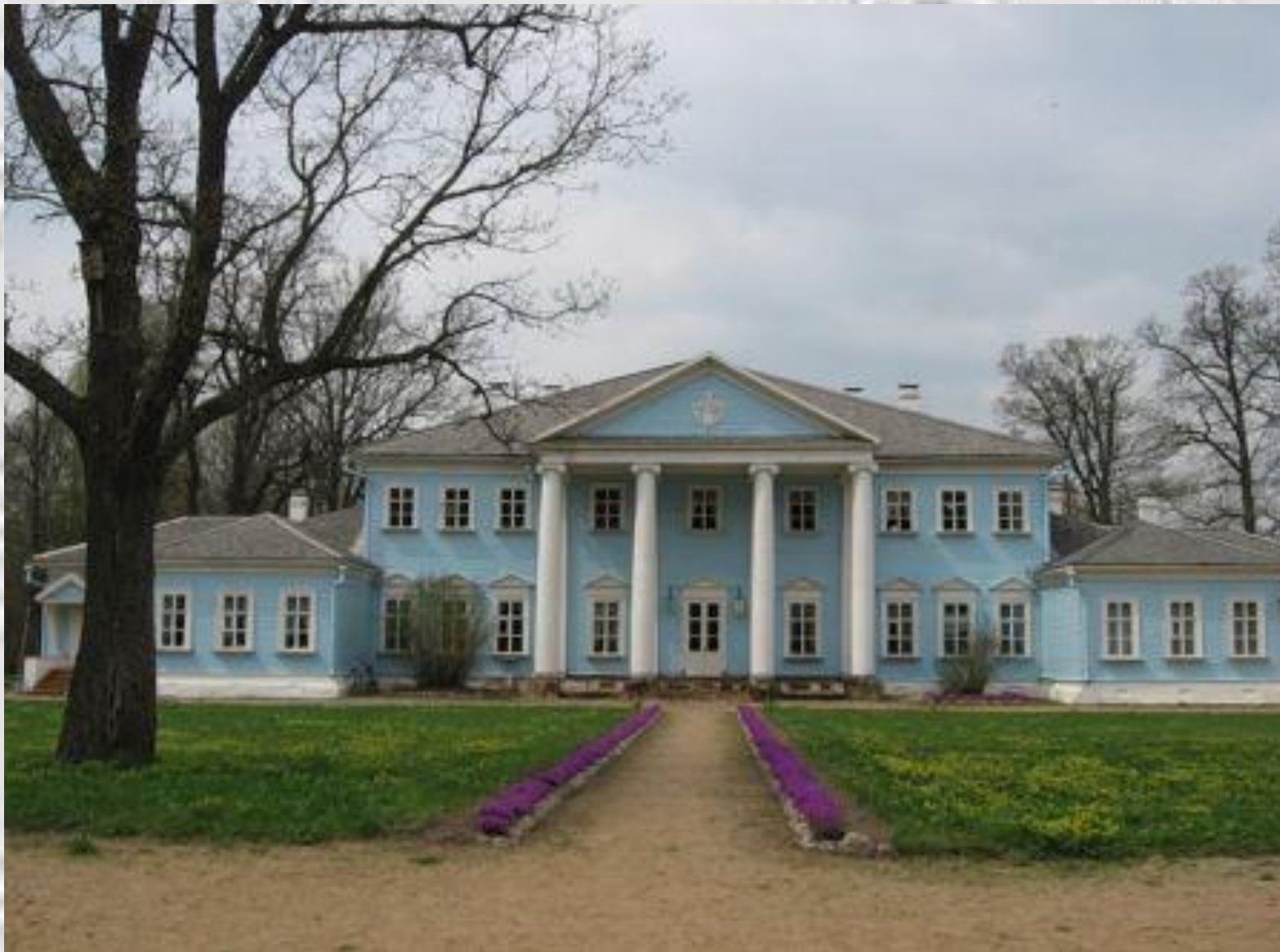
Фасад усадебного дома, лужайка перед которым называлась «Амуров лужок»