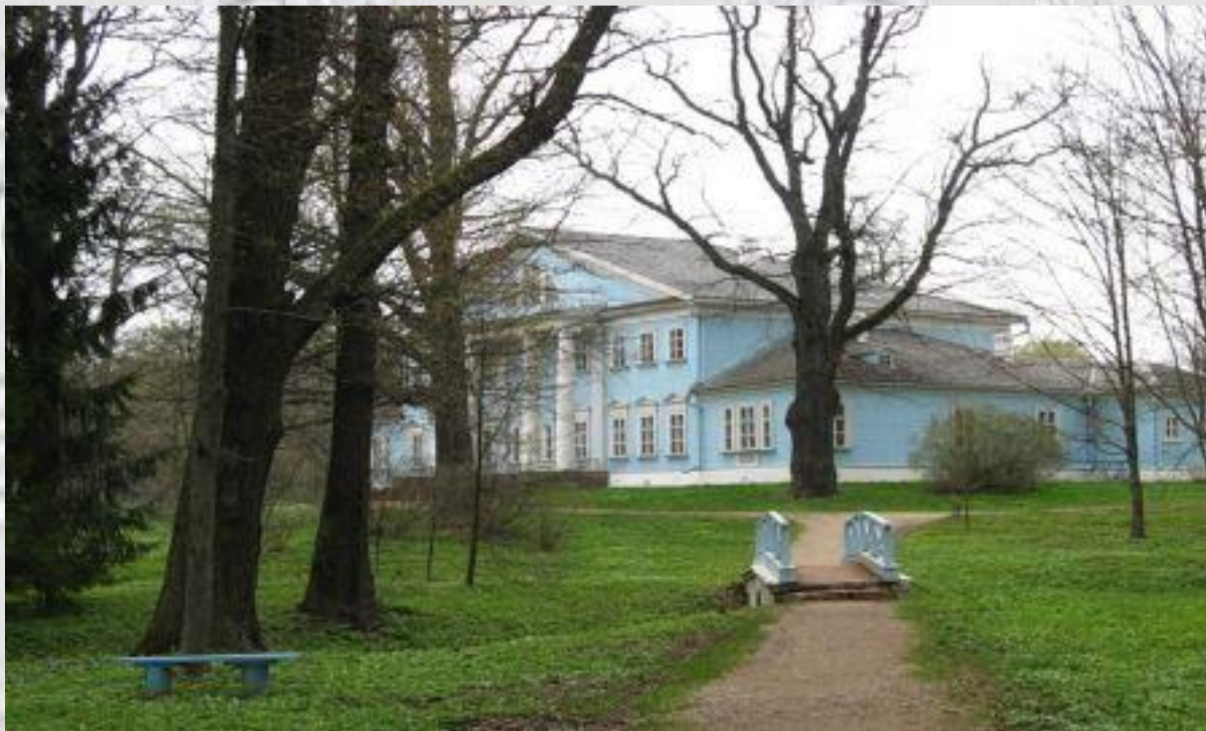
Усадьба Новоспасское находится в Ельнинском районе Смоленской области.