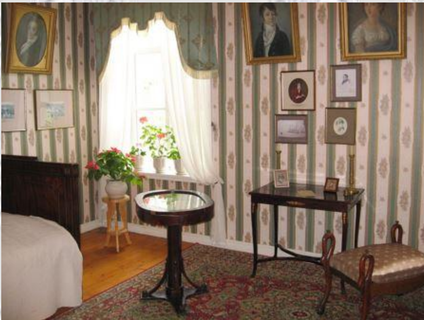
Комната матери композитора, Екатерины Андреевны Глинка (1784-1851), которая была троюродной сестрой своего мужа.