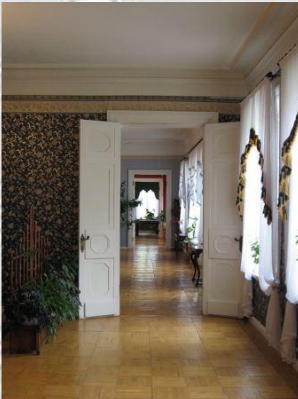
Анфилада комнат 1 этажа