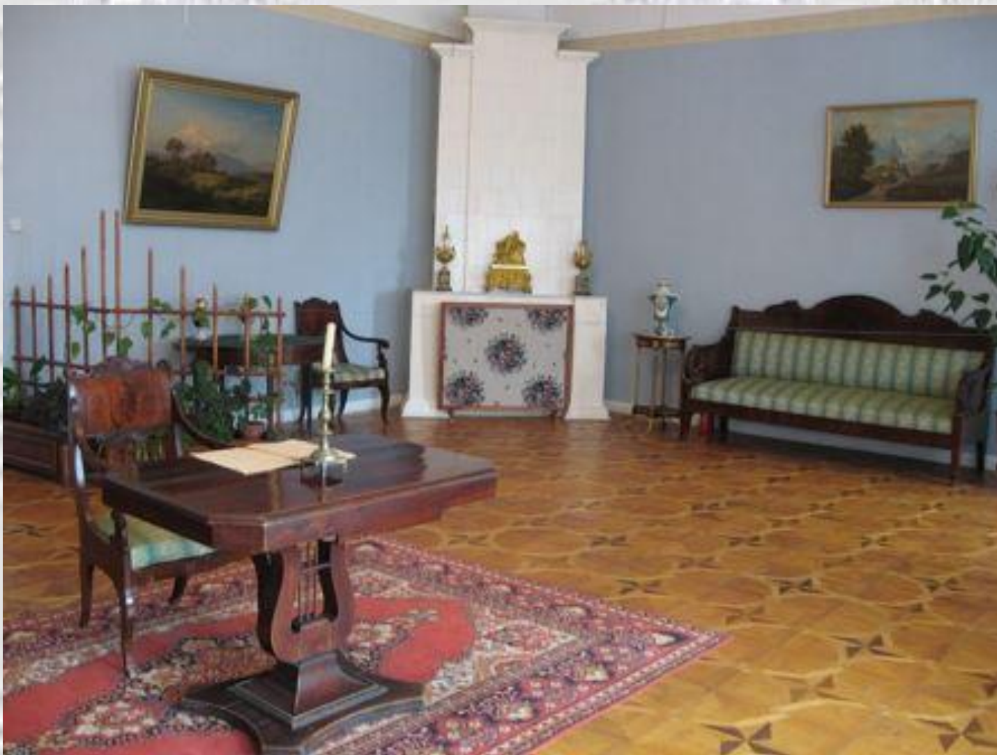
Рабочий стол композитора.