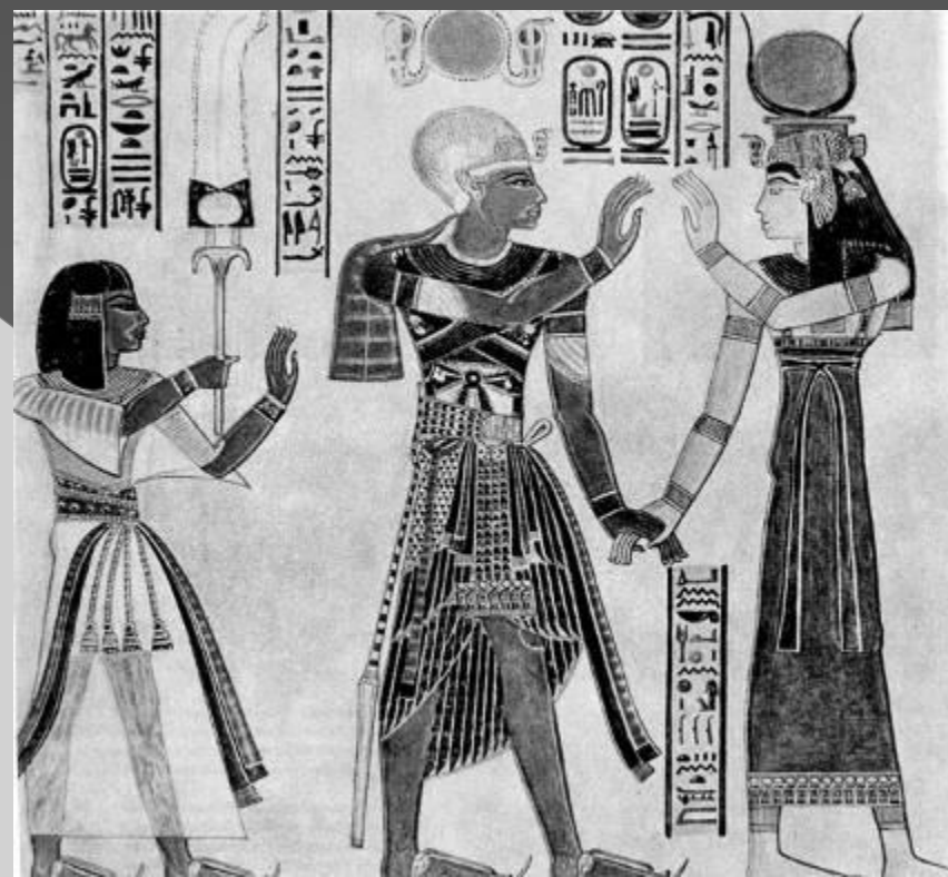
Первый прототип юбки