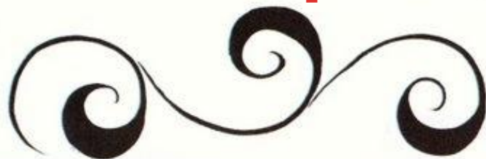
ВЕДУЩИЙ СТЕБЕЛЬ — «КРИУЛЬ»