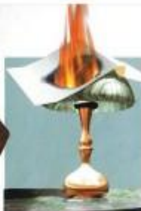
Затмение электролампы горючими материалами (бумагой, тканью)