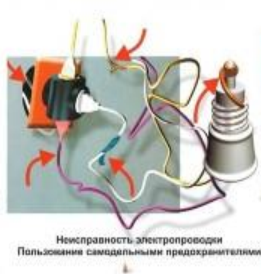
Неисправность электропроводки Пользование самодельными предохранителями