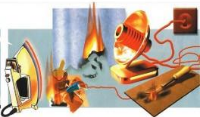
Оставление без присмотра электрических нагревательных приборов