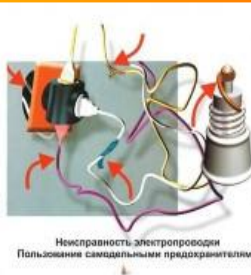
Неисправность электропроводки Пользование самодельными предохранителями