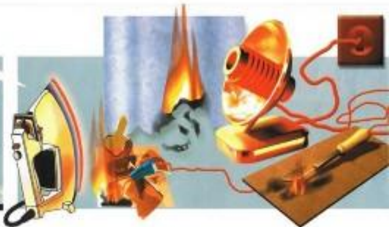
Оставление без присмотра электрических нагревательных приборов