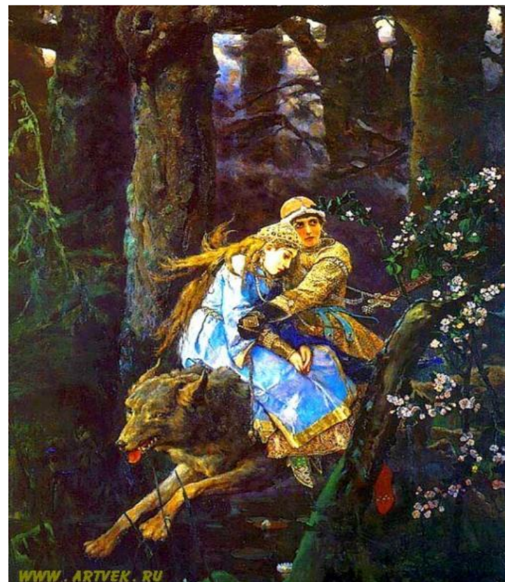
Иван Царевич на Сером Волке