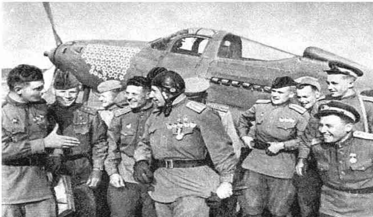
Боевые друзья поздравляют летчика-истребителя А. И. Покрышкина с присвоением ему в третий раз звания Героя Советского Союза.

19 августа 1944 года за образцовое выполнение боевых заданий командования, мужество, отвагу и героизм, проявленные в борьбе с немецко - фашистскими захватчиками, Указом Президиума Верховного Совета СССР Гвардии подполковник Покрышкин Александр Иванович был награждён третьей медалью "Золотая Звезда". Он стал первым в стране трижды Героем Советского Союза.