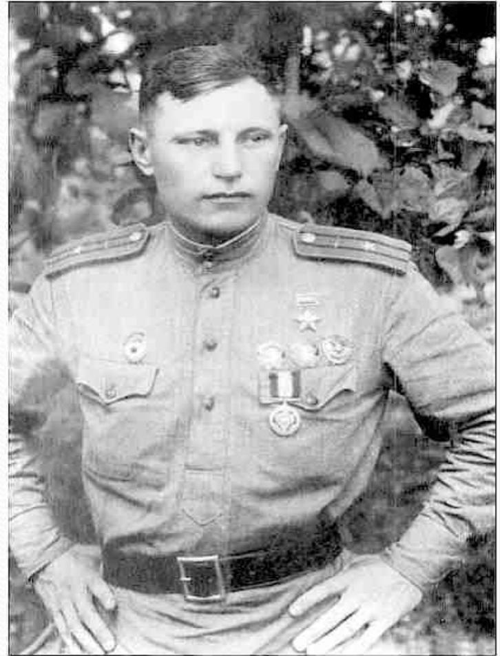
Майор А.И. Покрышкин по завершении сражений на Кубани, июнь-июль 1943 г. Под двумя орденами Ленина – американская медаль «За отличную службу» (Distinguished Service Medal) — третья по значимости военная награда США. Медаль вручена от имени президента Рузвельта, который назвал советского аса «выдающимся пилотом Объединенных Наций».