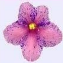
Классический фиалковый цветок*