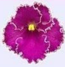
"Анютка" фиалковый цветок*