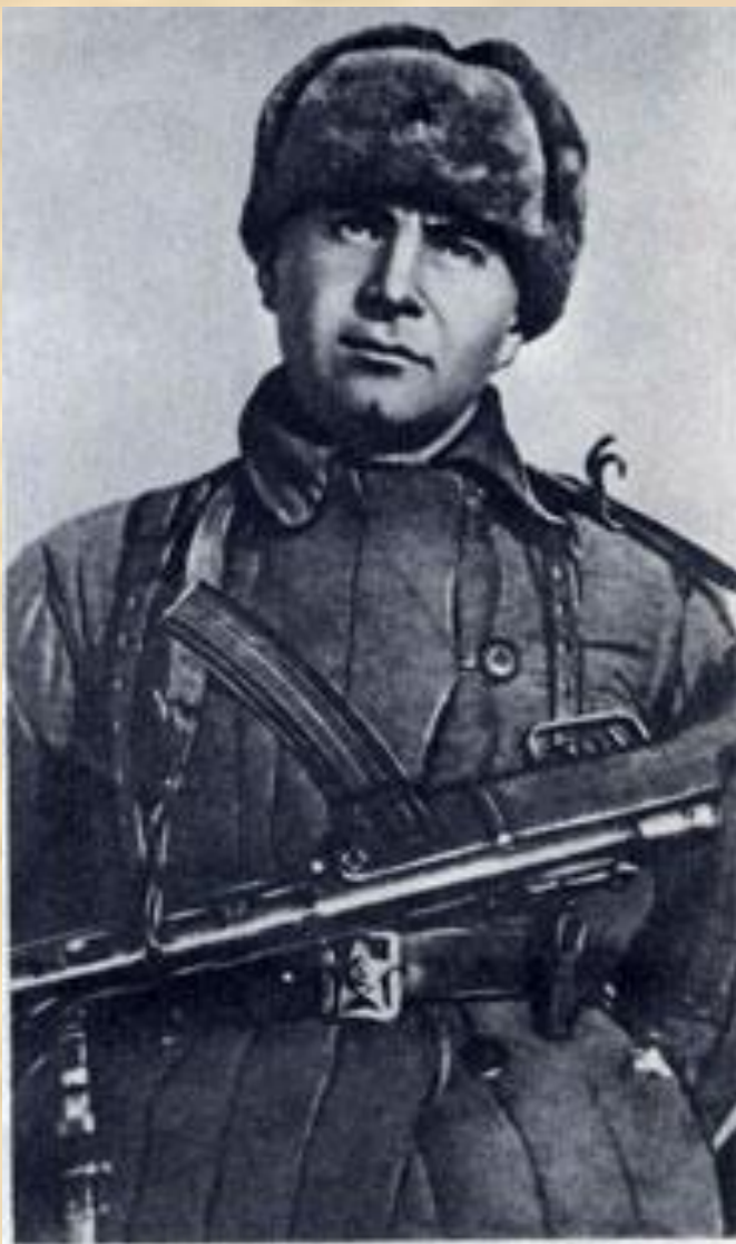
Герой Советского Союза Ц. Л. Куников в дни боёв под Новороссийском (1943 год).